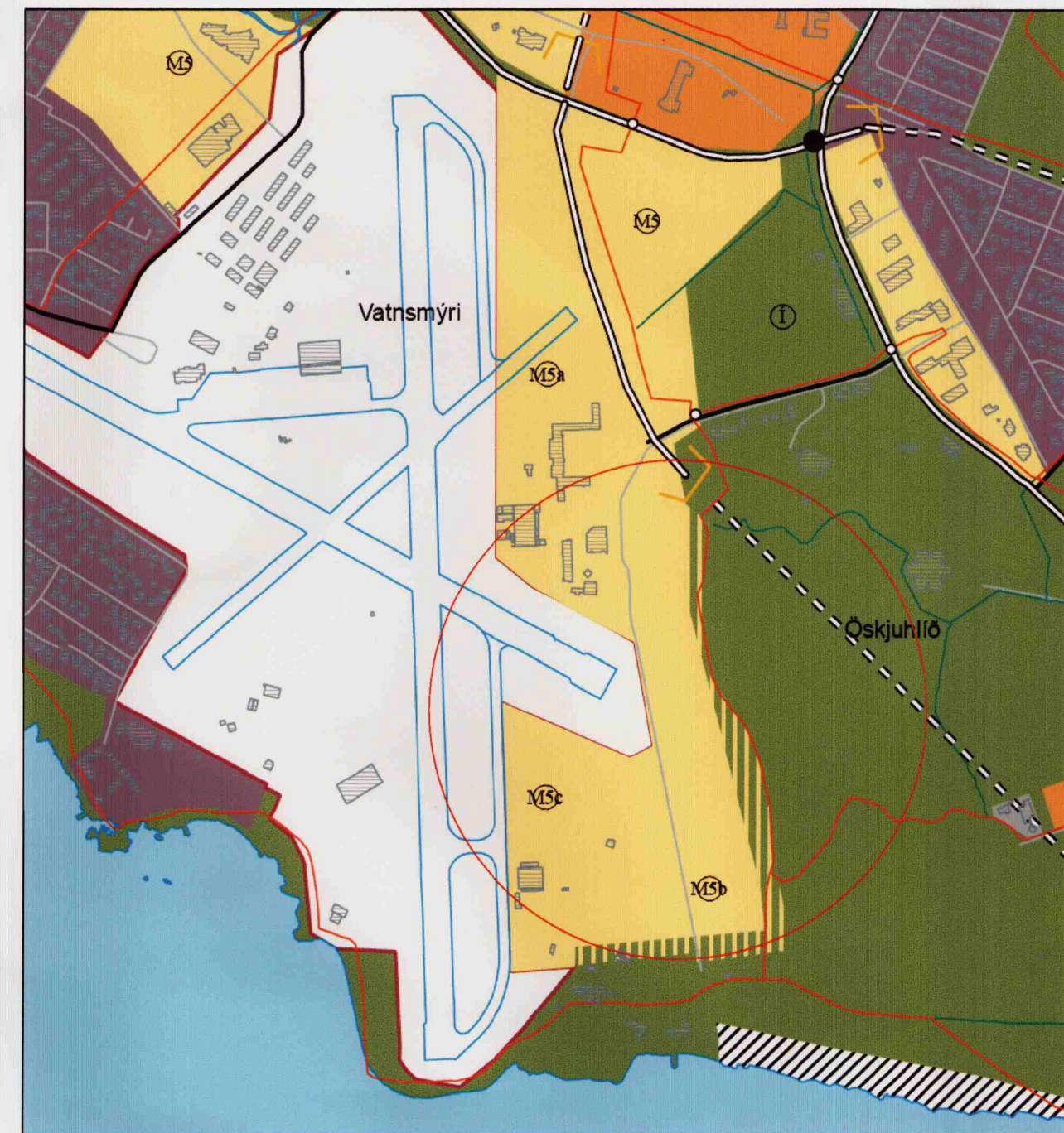
Aðalskipulag Reykjavíkur 2001-2024, breyting sem var staðfest af umhverfisráðherra 18. maí 2007.

Ath. Nýtingarhlutfall á lóðum ofanjarðar breytist ekki sbr. gildandi skipulagsskilmála.