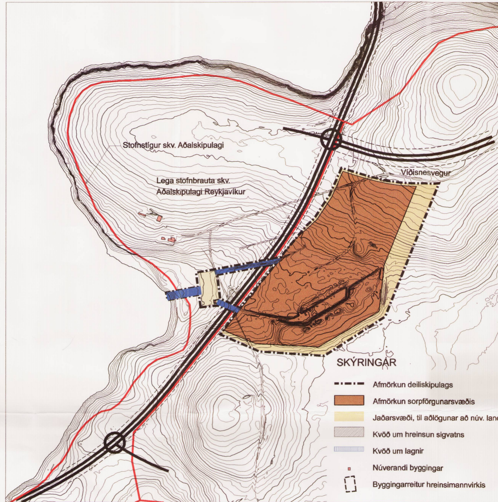
Tillaga að breytingu á deiliskipulagi af urðunarstaðnum í Álfsnesi. Mkv. 1:10.000

Vestan fyrirhugaðar Sundabrautar er athafnasvæði Sorpu, þar hefur verið komið upp búnaði fyrir hreinsun sigvatns. Á afmörkuðu reit innan athafnasvæðisins er kvöð um hreinsun sigvatns. Kvöð er um lagnaleiðir frá urðunarstað að hreinsibúnaði fyrir sigvatn, þar sem frárennsli frá botndreni urðunarsvæðis verður leitt í gengum vegfyllingu Sundabrautar. Byggingarreitur er afmarkaður umhverfis hreinsimannvirkis. Gera þarf breytingu á deiliskipulagi verði farið í byggingu stærra hreinsimannvirkis en þess sem fyrir er, þar sem gerð verður grein fyrir stærð og umfangi mannvirkis.