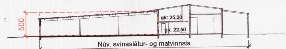
SKÝRINGARMYND Snið, mkv. 1:500 -fyrir breytingar

TAG teiknistofa Síðumála 9, 108 Reykjavík, sími: 568-6681, 699-4297, Kt: 640113-2190 Atli Jóhann Guðbjörnsson, Byggingafræðingur BFI, Kt: 260978-5789 netfang: atli@tagteiknistofa.is, www.TAGteiknistofa.is