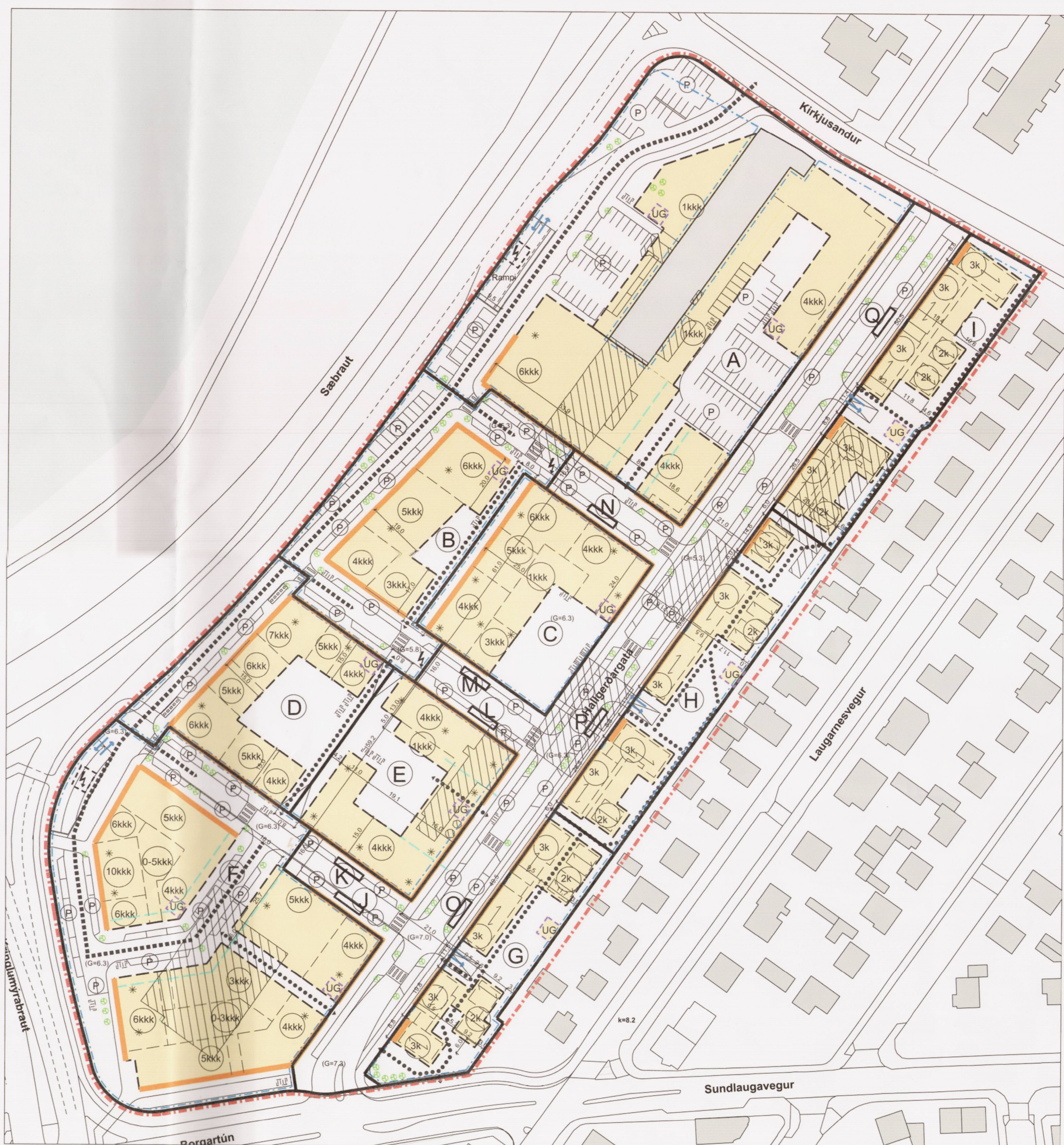
Tillaga að breyttu deiliskipulagi Mkv. 1:1000

DEILISKIPULAG Í GILDI Í gildi er deiliskipulag sem samþykkt var í borgarráði 28.4.2016 og birt í B-deild stjórnartíðinda 28.6.2016 og með síðari breytingum birt í B-deild stjórnartíðinda 16.11.2016.