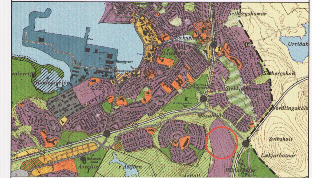
Aðalskipulag Hafnarfjarðar 2005-2025 — staðsetning í bæjarlandinu