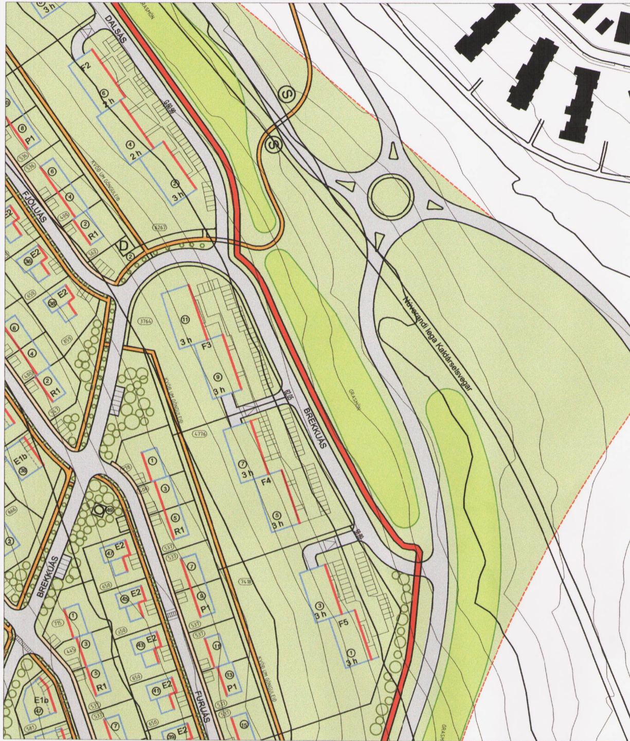
DEILISKIPULAG: ÁSLAND 3. ÁFANGI