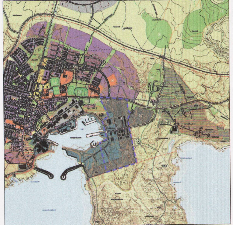
Úr tillögu að endurskoðuðu aðalskipulagi Grindavíkur 2010-2030

SAMÞYKKTIR Auglýsing um gjöldstéku deiliskipulagsins var birt í B-eldis stjórnartíðinda þann 19. júlí 2012 Deiliskipulag þetta, sem auglýst hefur verið samkvæmt 41. grein Skipulagslaga nr. 123 / 2010 var samþykkt í Skipulags- og byggingarnefnd: þann 9. júlí 2012 Bæjarstjórn: þann 18. júlí 2012 Tillagan var auglýst frá 6. september 2011 með athugasemdafrestri til 19. október 2011 [Signature and Stamp]