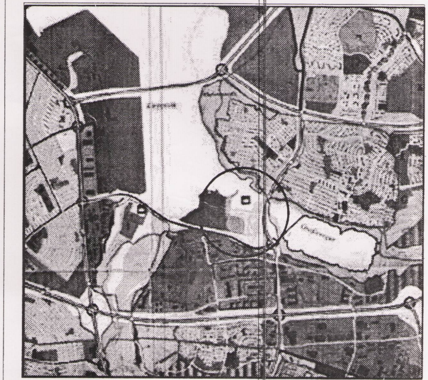
HLUTI AÐALSKIPULAGS REYKJAVÍKUR 1996-2016

Ath : Nákvæm stærð lóða mun koma fram á gögnum mælingardeilar Borgarverfræðings.