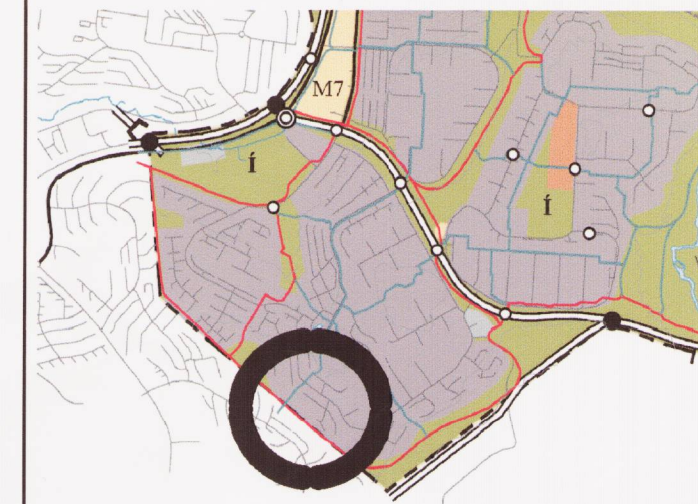
Yfirlitsmynd úr aðalskipulagi Reykjavíkur 2001-2024 sem sýnir staðsetningu á deiliskipulagi, ekki í kvarða