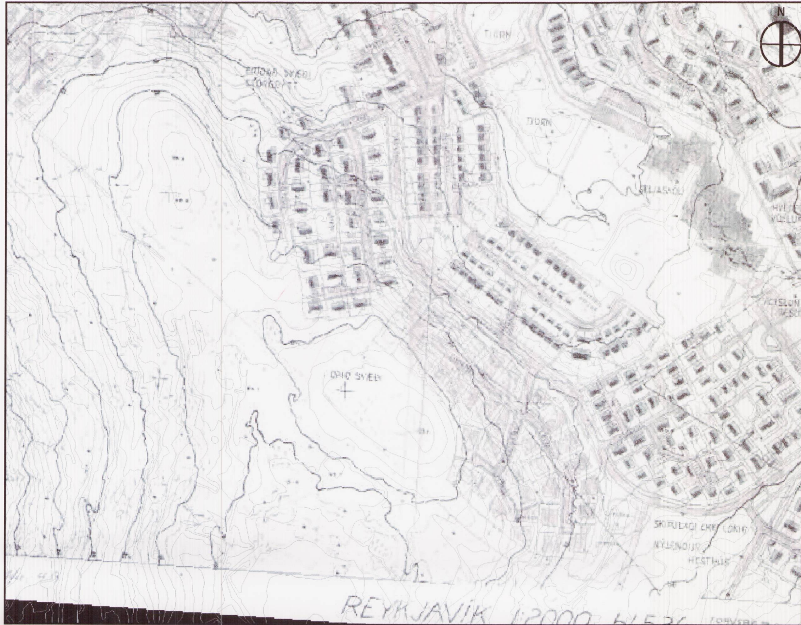
HLUTI AF GILDANDI DEILISKIPULAGI, Seljahverfi, uppfært og samþykkt 1976 og 1977, MKV. 1:4000