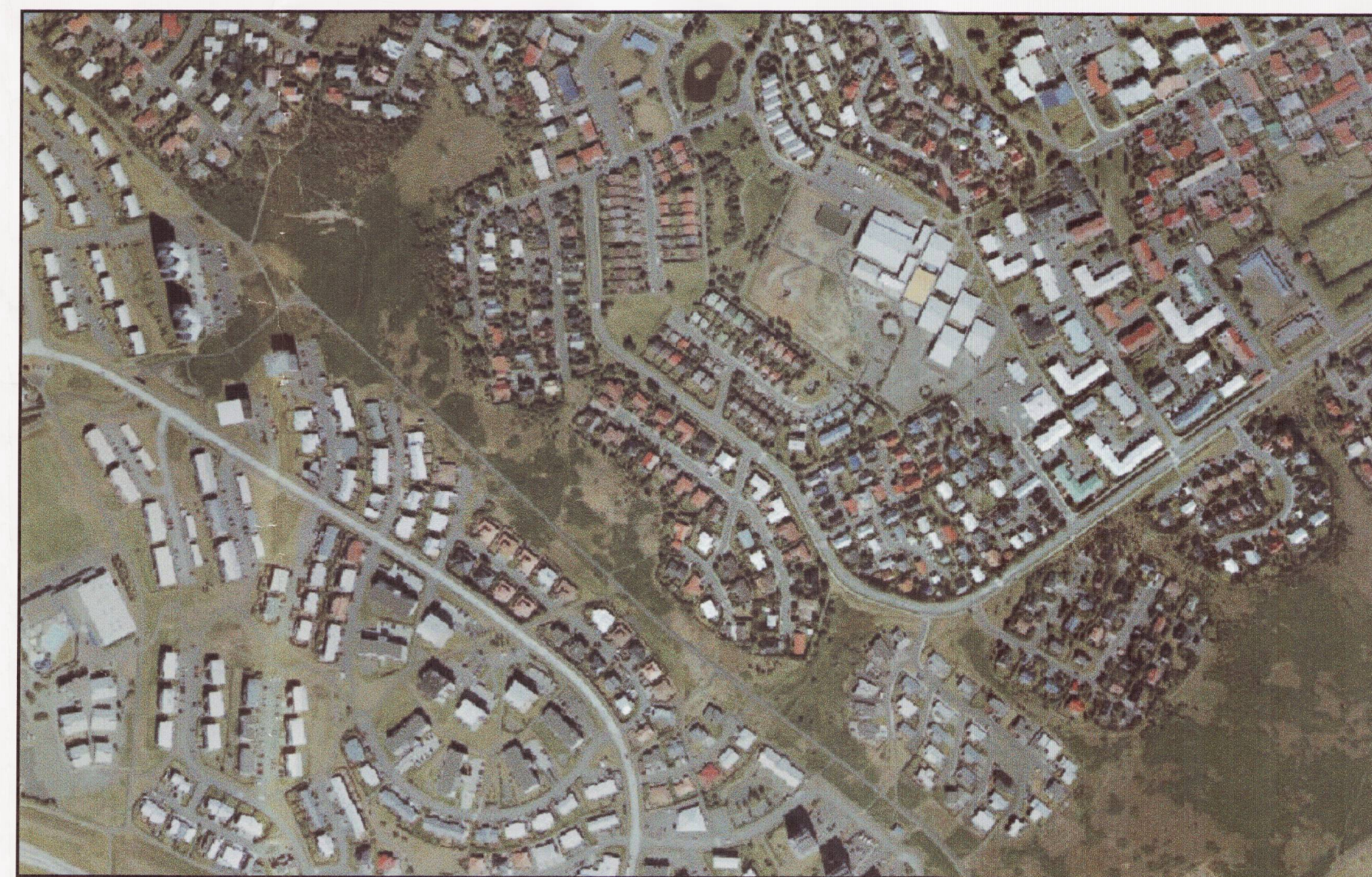
SKÝRINGARMYND - loftmynd af núverandi aðstæðum Mkv. 1:2000