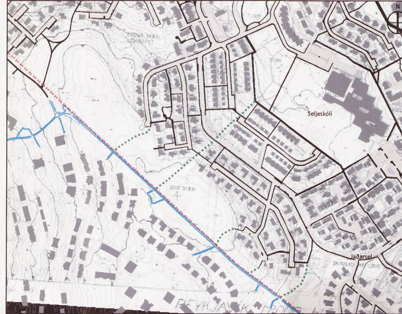
TILLAGA AÐ BREYTTU DEILISKIPULAGI, MKV. 1:2000