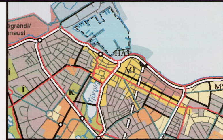
YFIRLITSMYND UR AÐALSKIPULAGI REYKJAVÍKUR 2001-2024