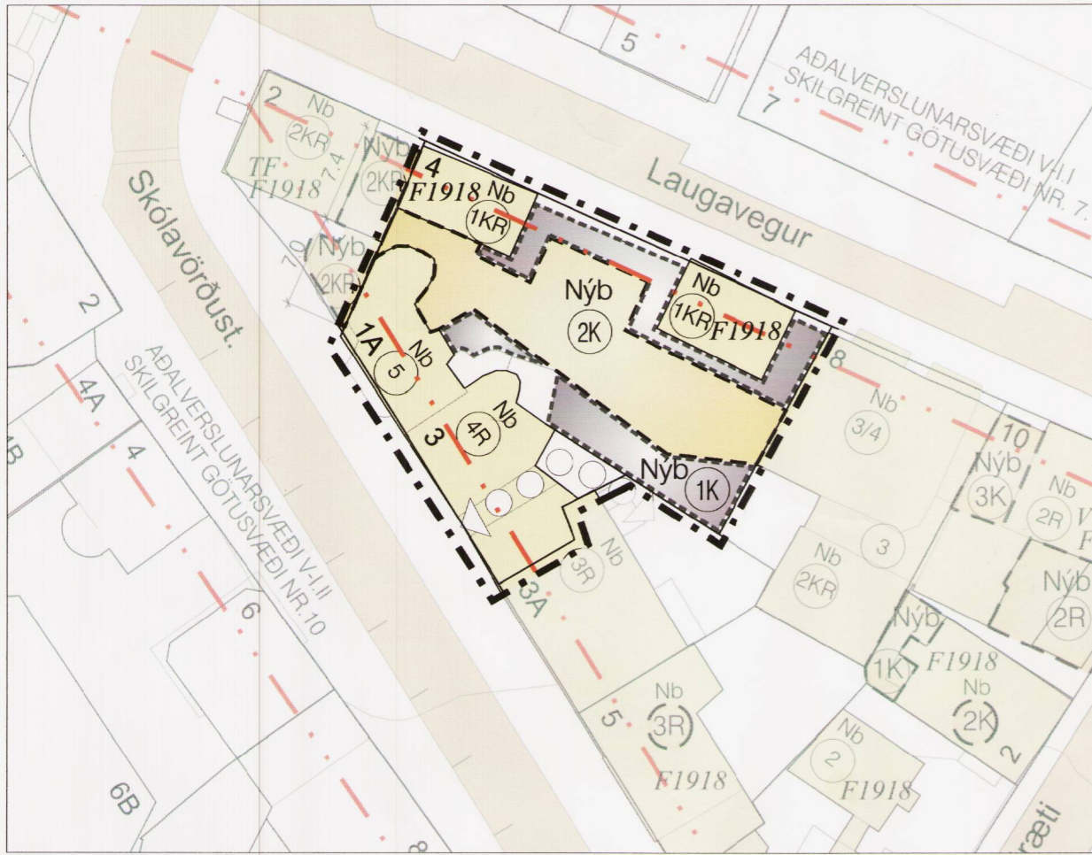
GILDANDI DEILISKIPULAG MKV 1:500

Samþykkt í Borgarráði 02.10.2008 Auglýst í B-deild stjórnartíðinda 10.11.2008