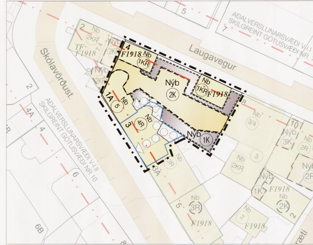
TILLAGA AÐ BREYTTU DEILISKIPULAGI MKV 1:500

Samþykkt í Borgarráði 02.10.2008 Auglýst í B-deild stjórnartíðinda 10.11.2008