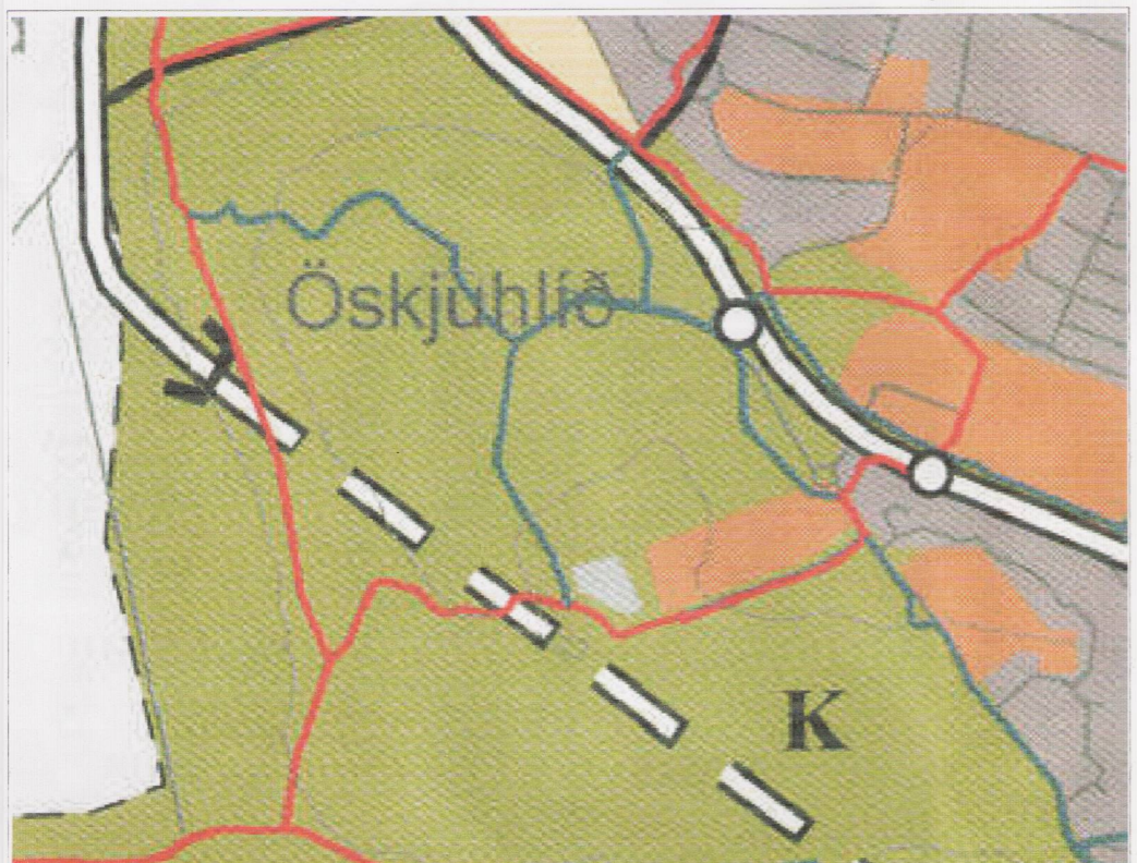
Aðalskipulag Reykjavíkur 2001-2024