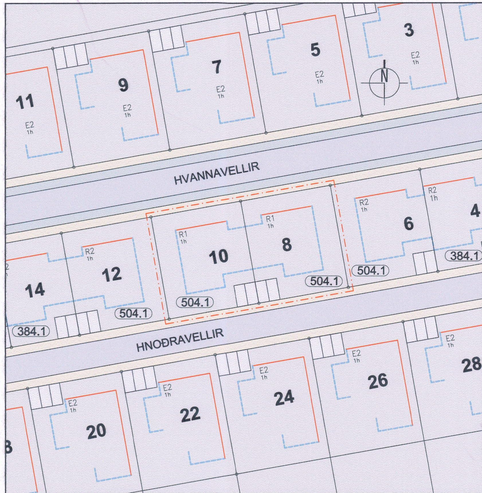
SAMPYKKT DEILISKIPULAG - DAGS. 24.01.2006