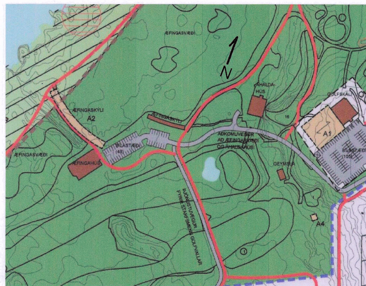
Úrdráttur úr gildandi deiliskipulagi Hvaleyrar, golfvöllur frá 13.12.2005 með síðari breytingum. mkv. 1:3000

Leitast verður við að Vélageymslan falli að umhverfi sínu en staðsetningin tekur mið af vinnusvæði starfsmanna Keilis og tengingu við núverandi áhaldahús. Sunnan við byggingareitinn liggur kambur sem mun að hluta til fela ásýnds hússins frá núverandi byggð í Hamrabbyggð. Sjá skýringarmynd.