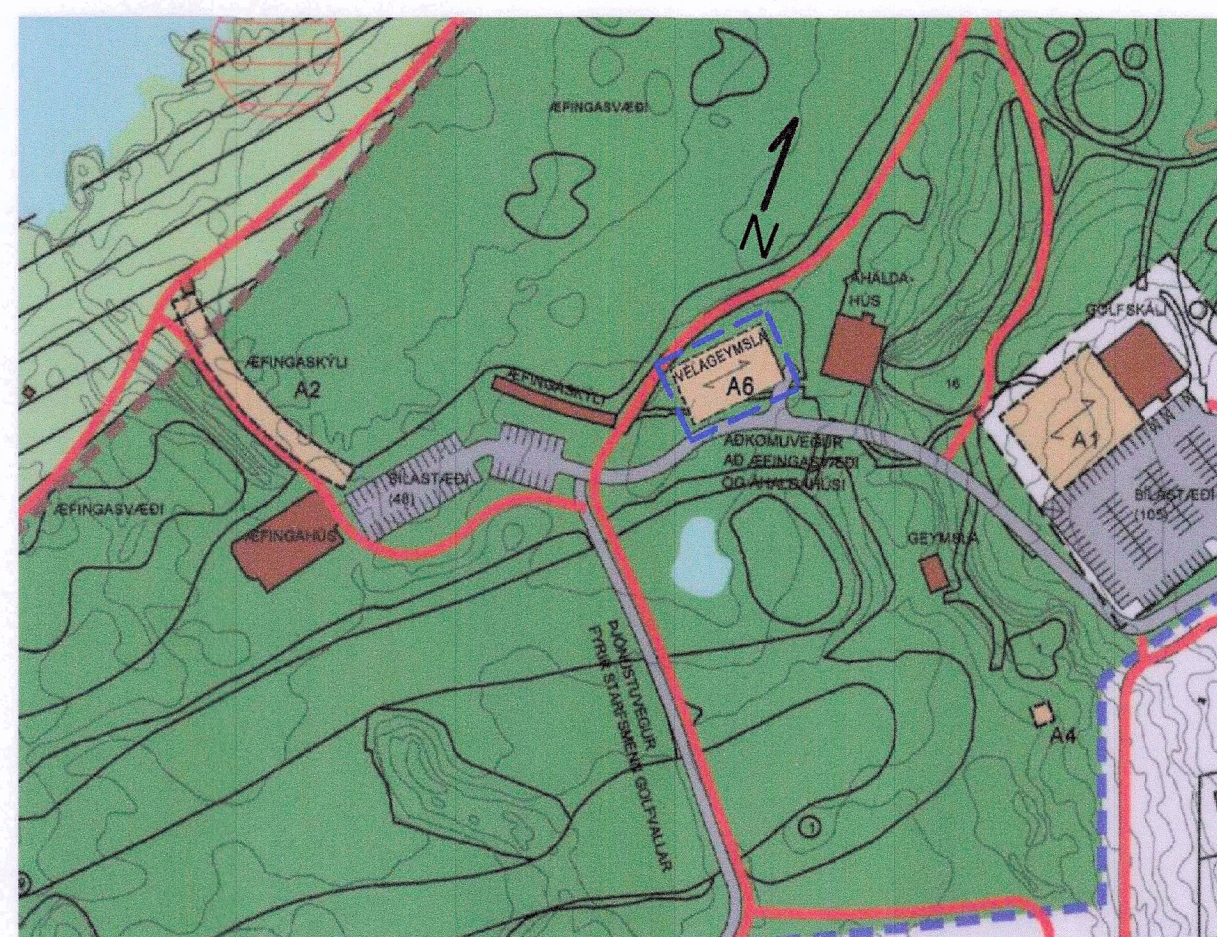
Tillaga að breyttu deiliskipulagi. mkv 1:3000