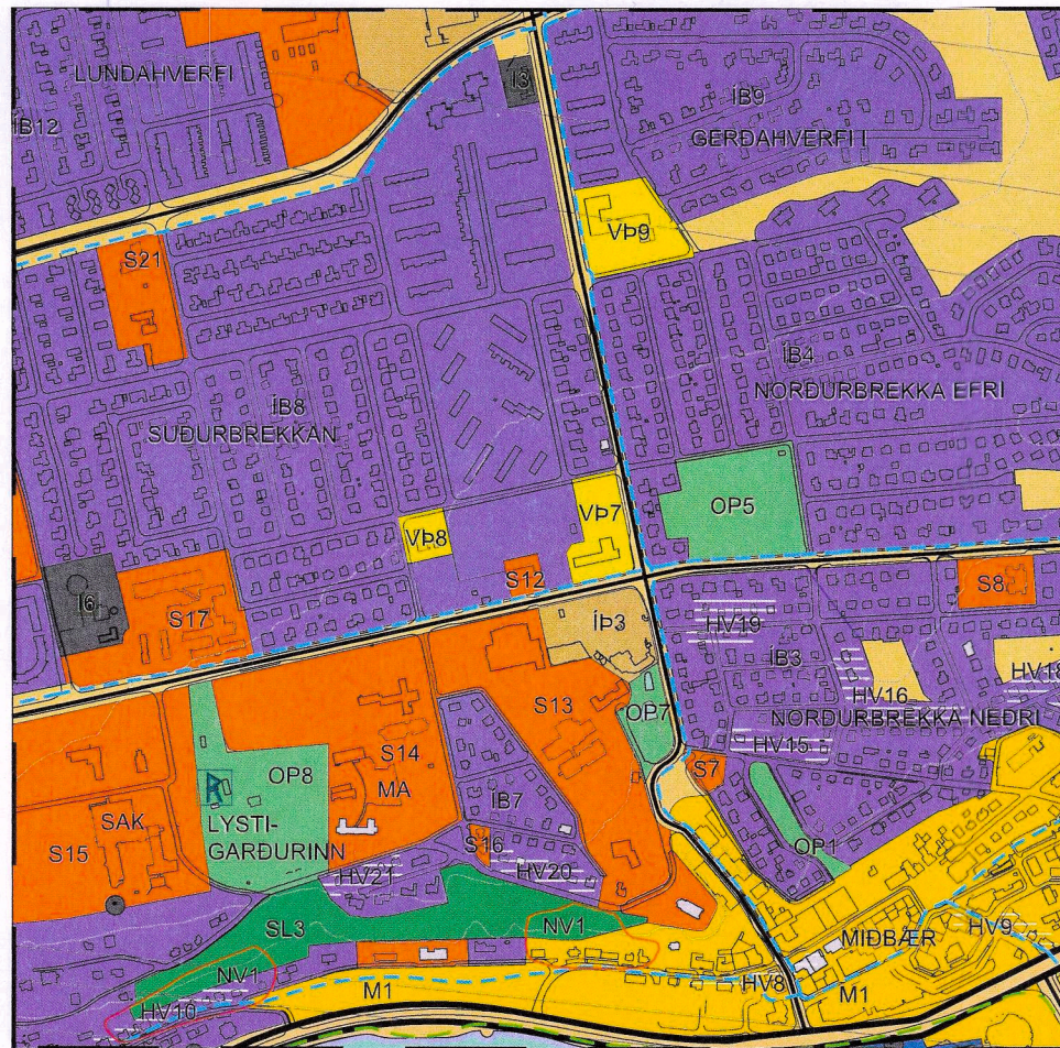
GILDANDI AÐALSKIPULAG, ÖBLAÐIST GILDI 14.05.2018, M.S.BR.