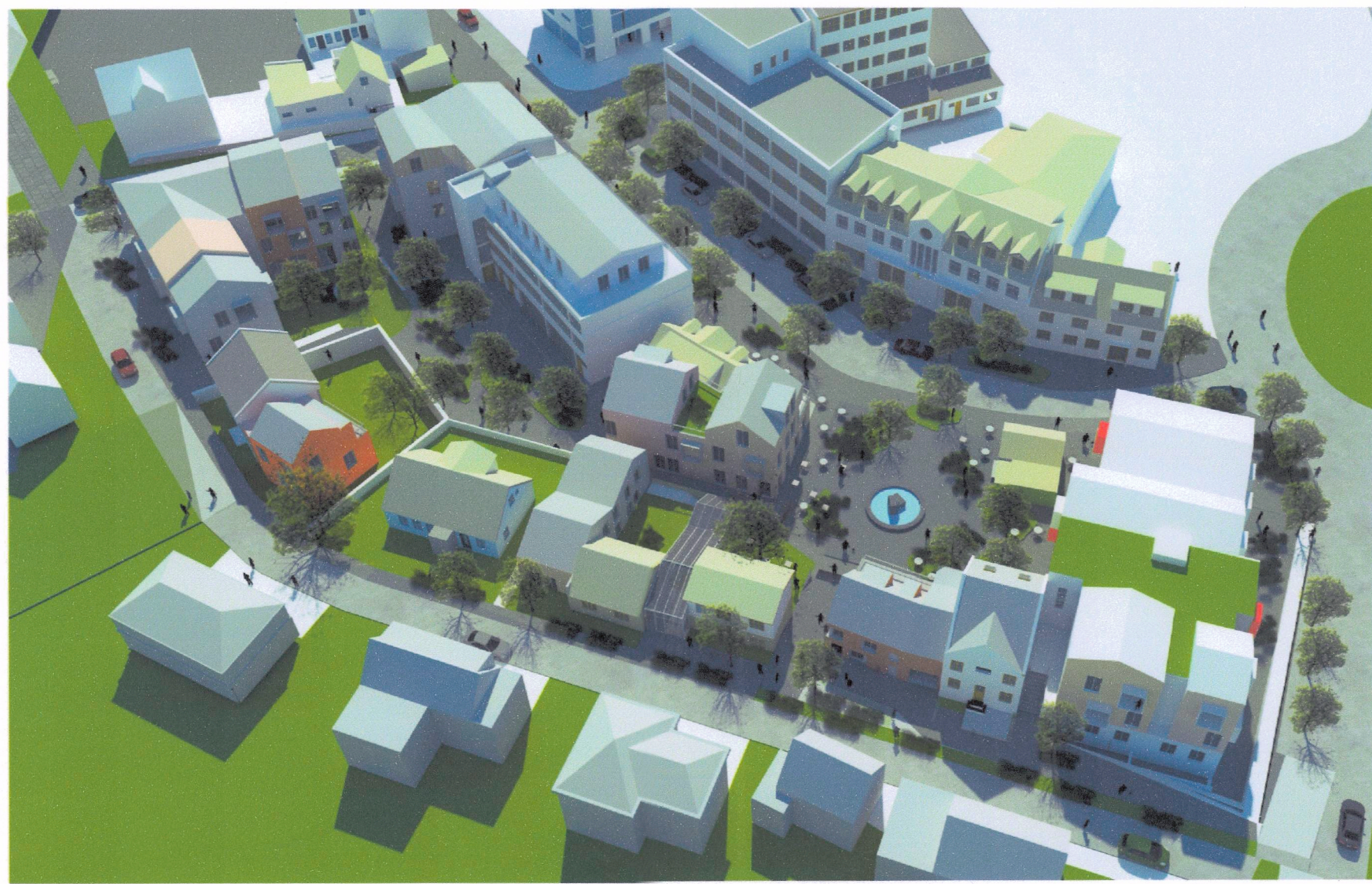
Yfirlitsmynd reitur 1, horft til austur