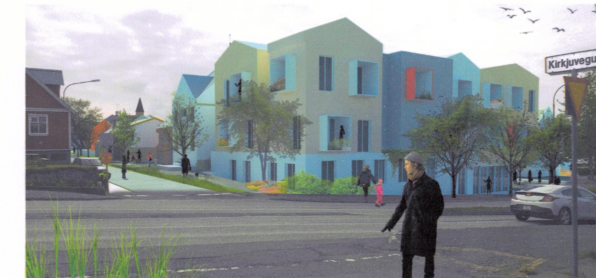
Horn Austurgötu og Reykjavíkurvegar.