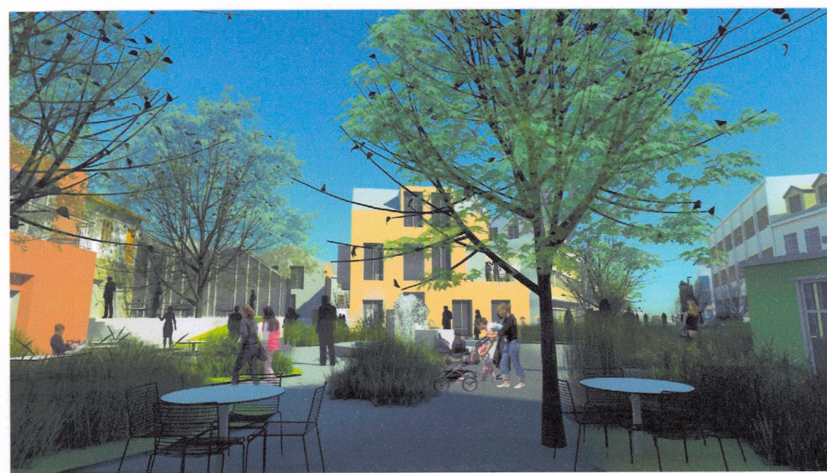
Ráðhústorg til austur