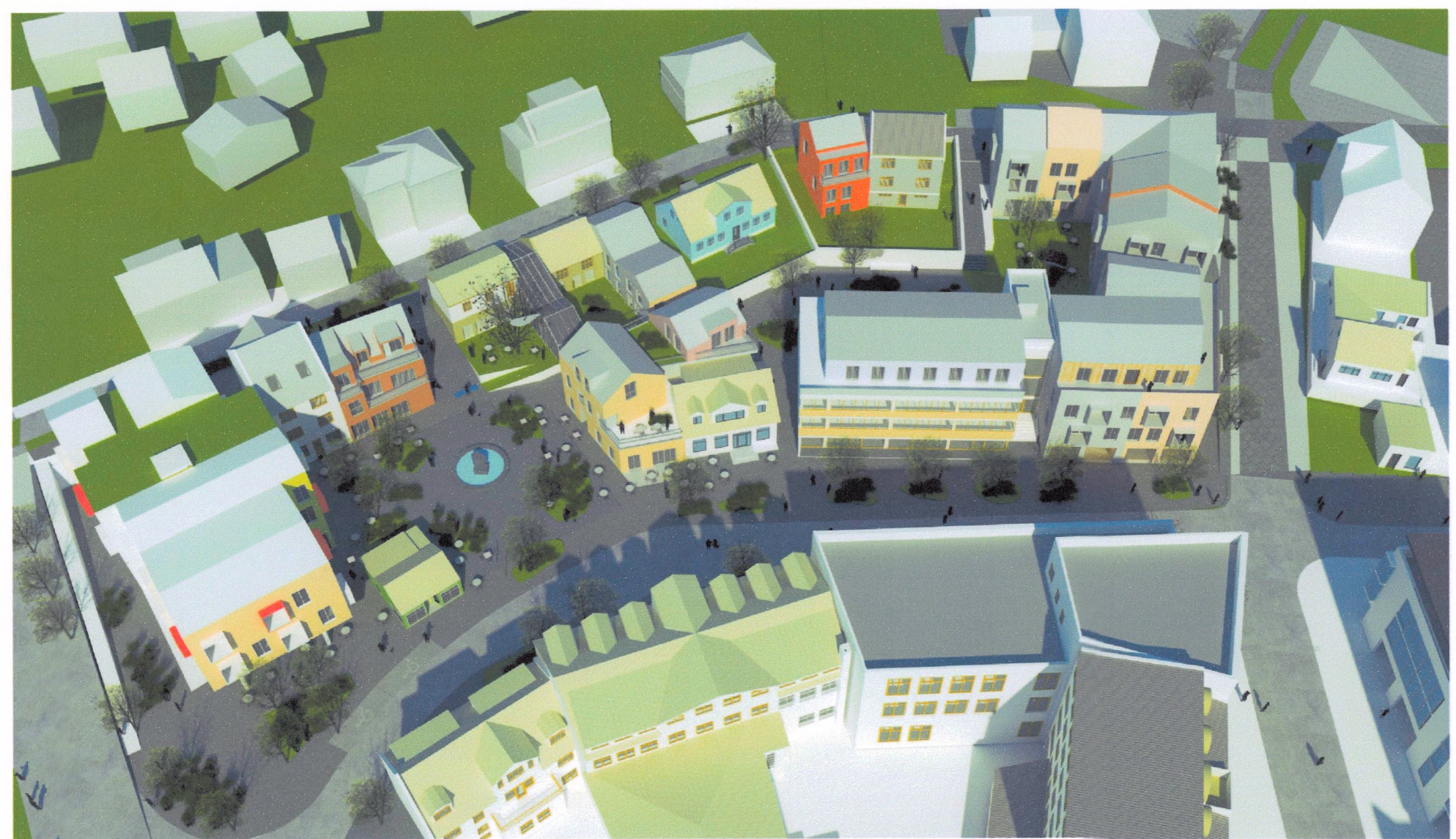
Yfirlitsmynd reitur 1, horft til norður