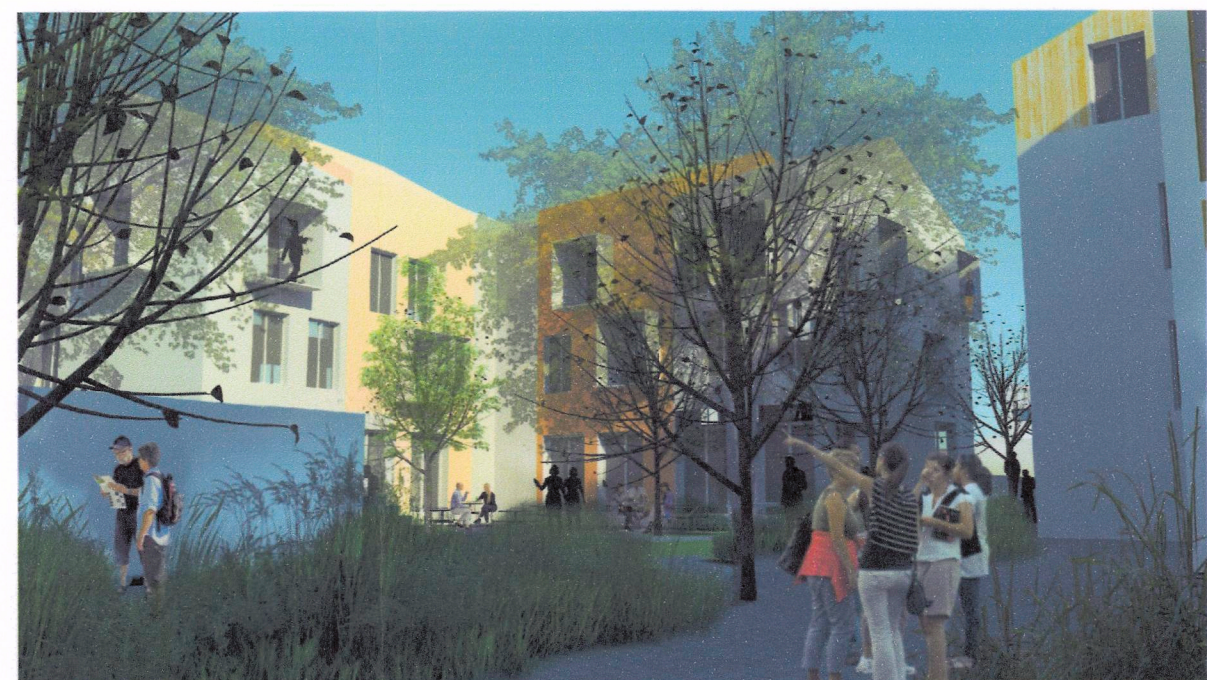
Millistígur til austur