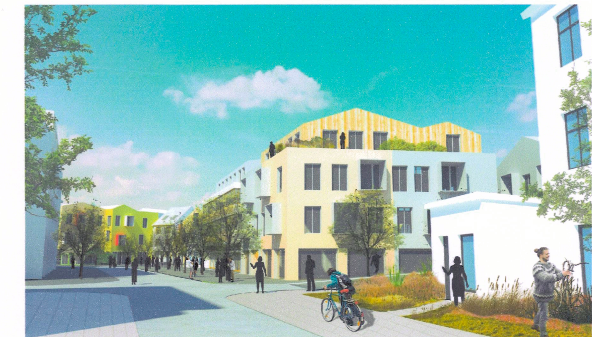
Strandgata til vestur