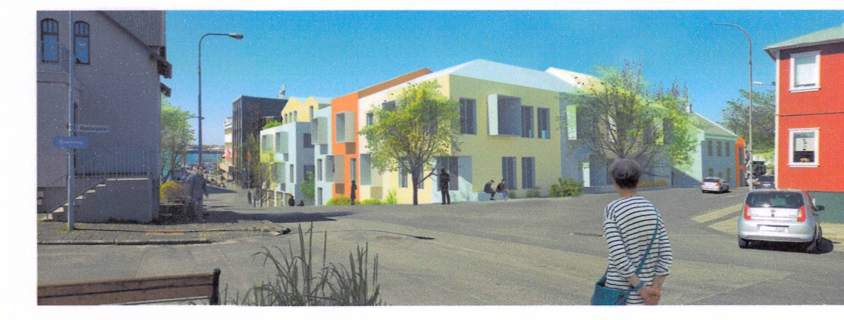
Gatnamót Austurgötu og Linnestígs.

DEILISKIPULAGSBREYTING: ÞESSU SEM FENGIO HEFUR MÁLSMEYFERÐ Í SAMRÆMI VED ÁKVÆÐI 1. MGR. 43. GR. SKIPULAGSLAGA SAMMYTJÓT I DEILISKIPULAGS- OG BYGGINGARHAGI HAFNAFJARÐAR BARNI 21.7.2021 OG I DEILISKAÐI BARNI 21.7.2021 F. H. BUEIARSTJÓRNAR HAFNAFJARÐAR BARNI 21.7.2021 TEIAGAÐ VAS AULEYFT FRÁ 19/6 2021 MED ATHVAÐAMAFRETTI TL. 21/6 2021 ALÍKÝSING UM GILDEIÖGLI BREYTINGARINNAR VAS BIRT I B. DEILD STJÓRNARTÍÐNDA BARNI 29.06.2021