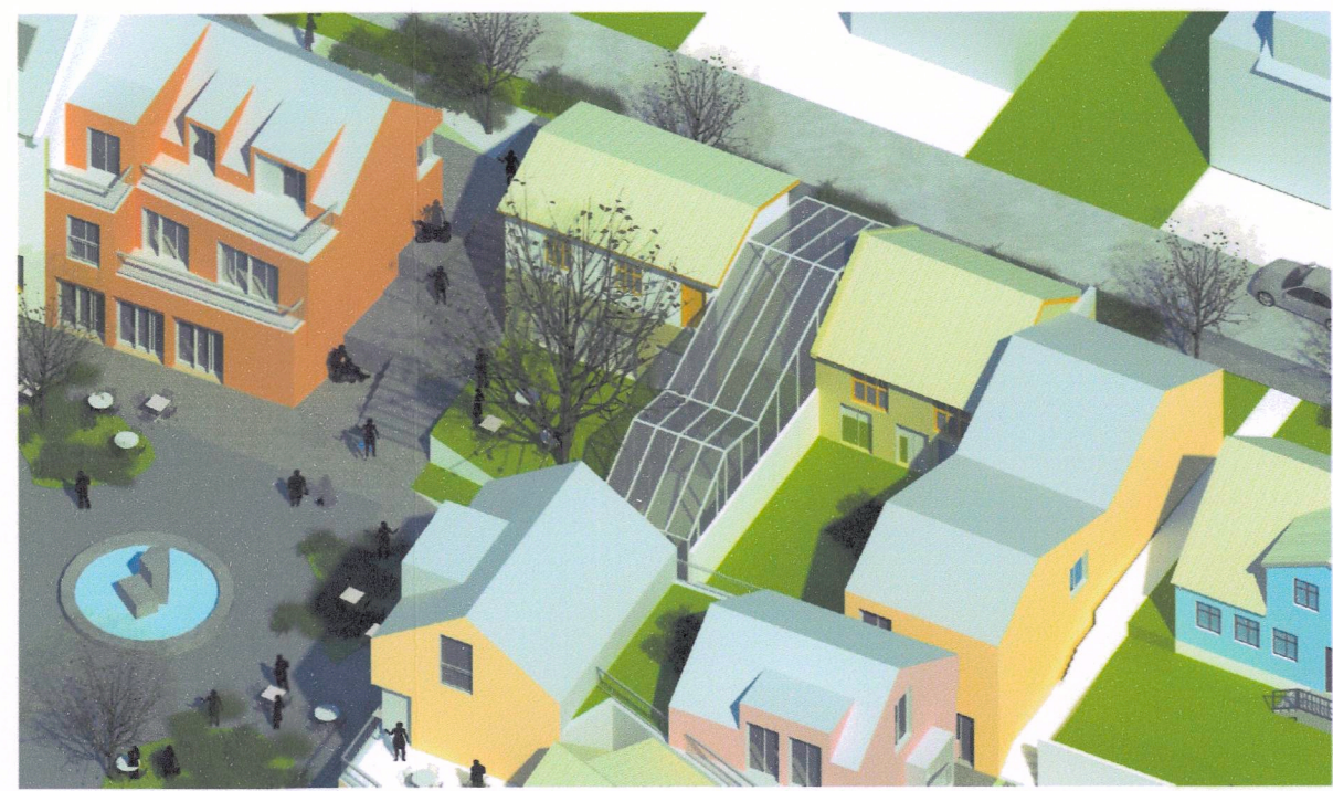
Aðgengi fyrir alla - útilyfta við tröppur