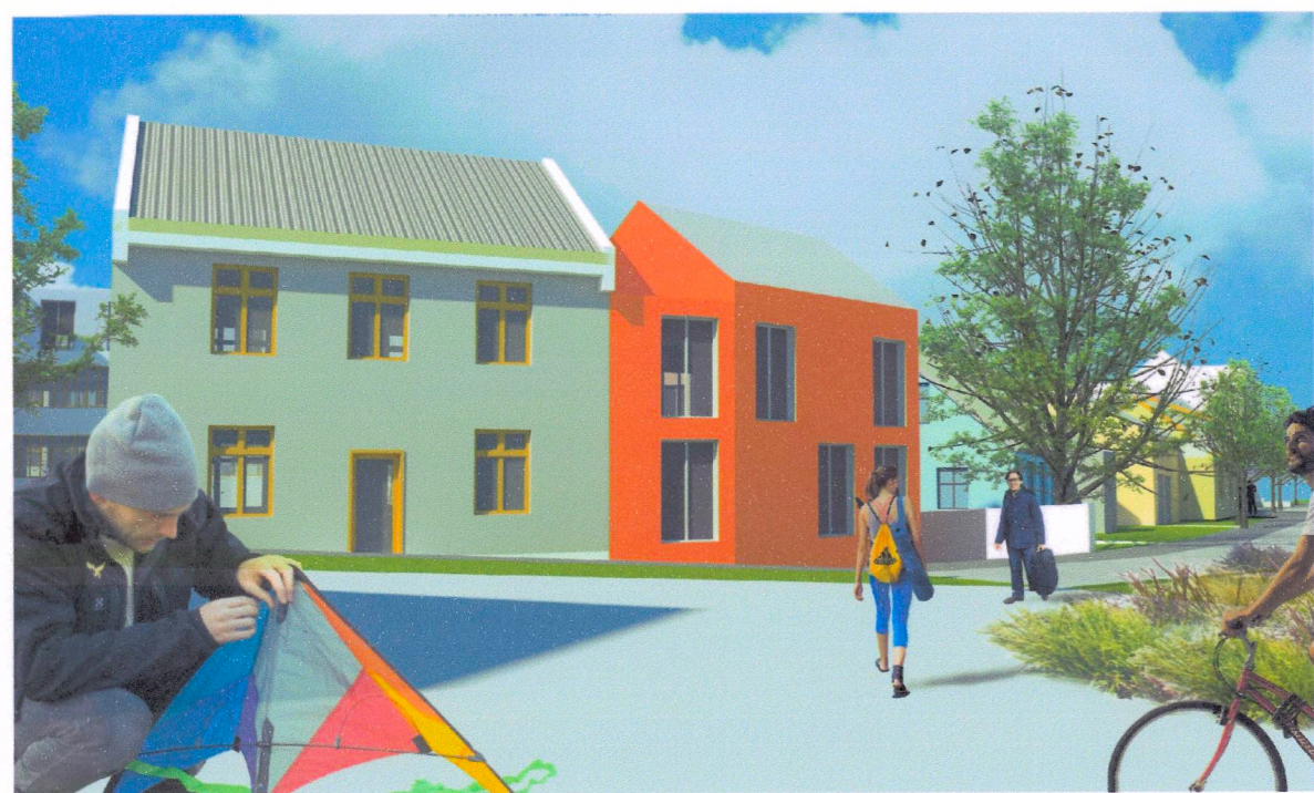
Austurgata 16 og 14