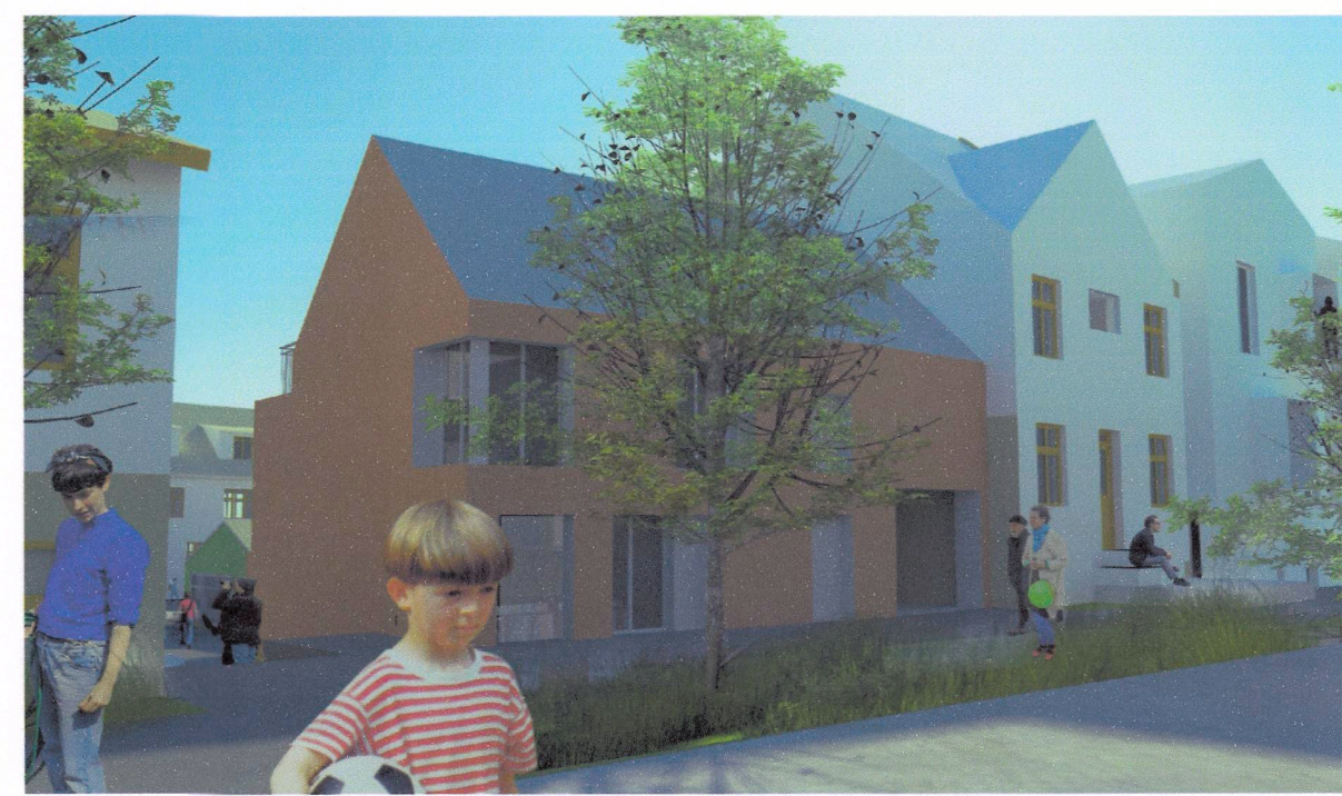
Austurgata til vestur- tröppur að Ráðhústorgi