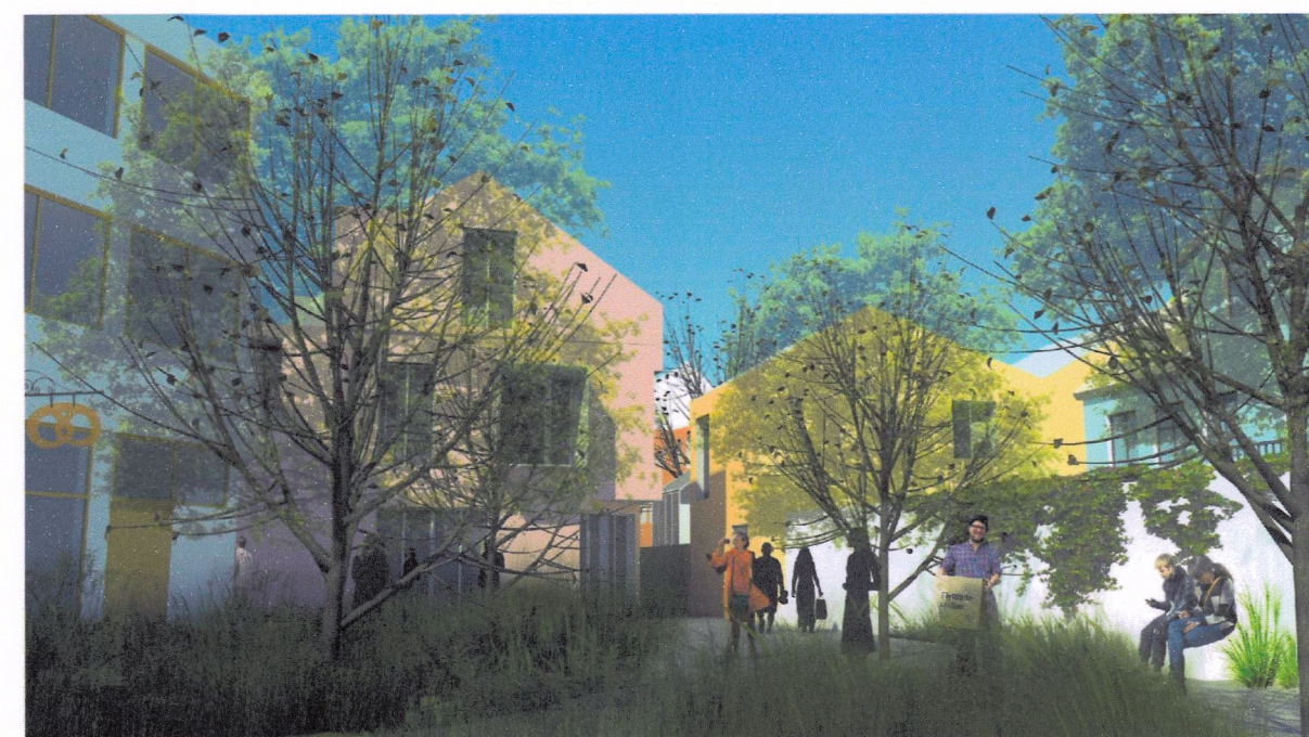
Millistígur til vestur