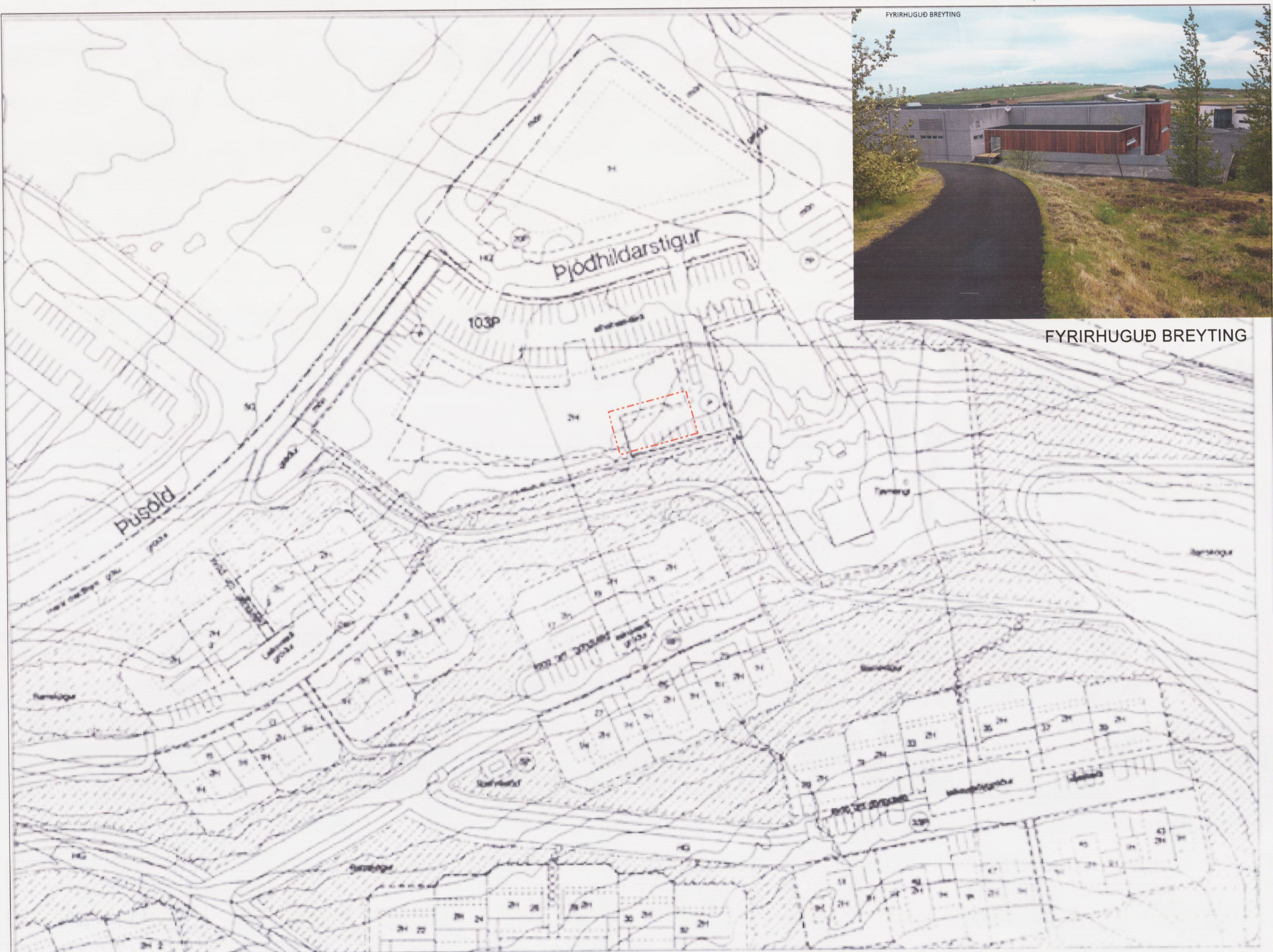
TILLAGA AÐ BREYTINGU