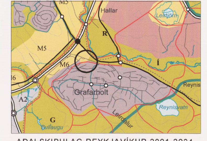
ADALSKIPULAG REYKJAVIKUR 2001-2024