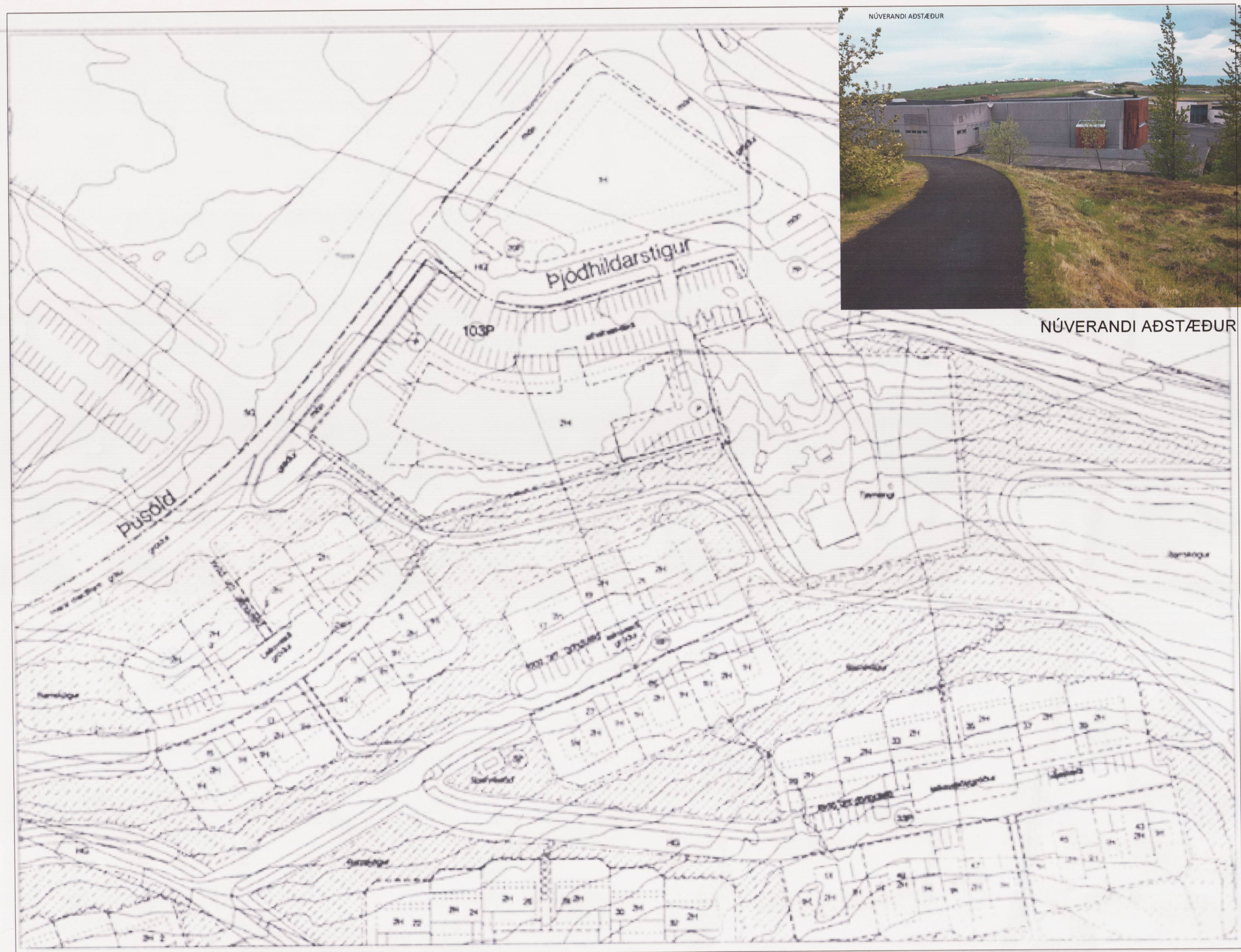
GILDANDI SKIPULAG SVÆÐI 3G - SAMÞYKKT Í BORGARRÁÐI 04.11.2005