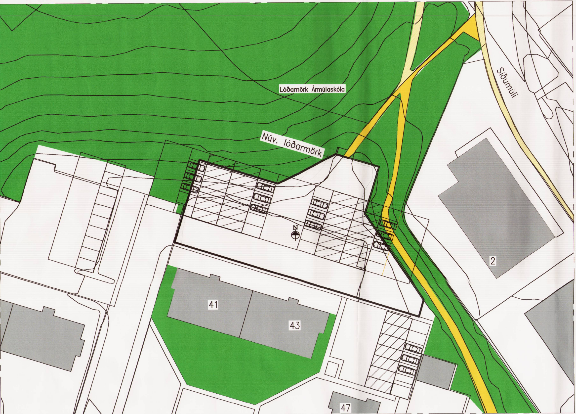
Staðfest deiliskipulag af svæðinu með áorðnum breytingum