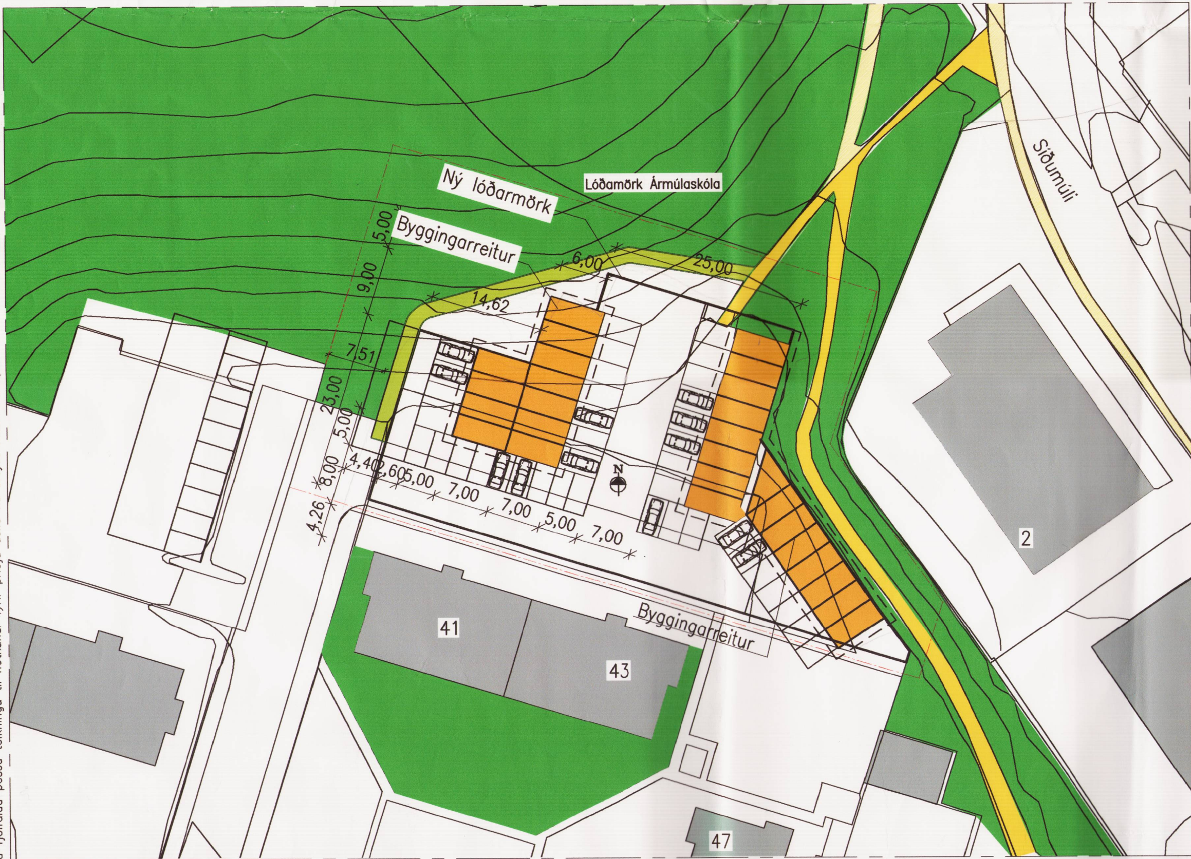
BREYTT DEILISKIPULAG, 1:500