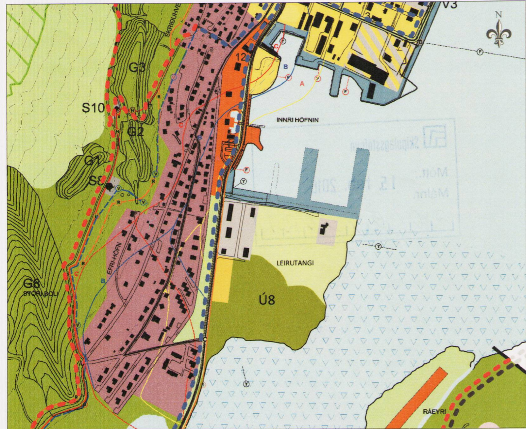
Tillaga að breytingu Mkv. 1:10.000 í A3

Bæjarstjórn Fjallabyggðar leggur til að landnotkun á Leirutanga verði breytt. Leirutangi er landfylling á leirum austan Snorrögötu á Siglufirði. Þar er gamall urðunarstaður og hefur mengun mælst á svæðinu. Undanfarnin ár hefur svæðið verið notað sem tippur fyrir jarðefni og óvirkan úrgang. Á svæðinu er steypistöð og nokkur fyrirtæki á athafnalóðum við Vesturtanga. Ákveðið hefur verið að nýta svæðið til útivistar fyrir bæjarbúa, griðland fugla og sem tjaldsvæði þar sem núverandi tjaldsvæði í miðbænum þykir ekki hentugt.