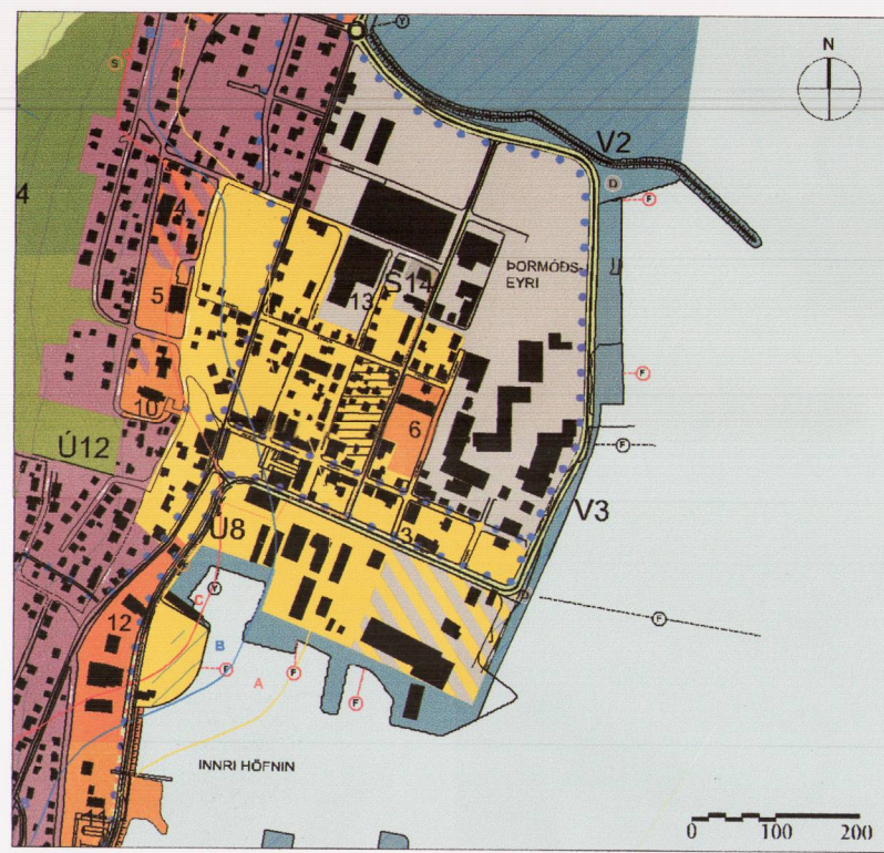
Staðfest aðalskipulag, staðfest 22.12.2010