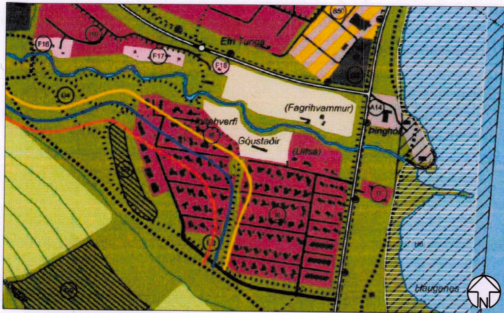
GILDANDI AÐALSKIPULAG Staðfest af umhverfisráðherra 18.03.2010