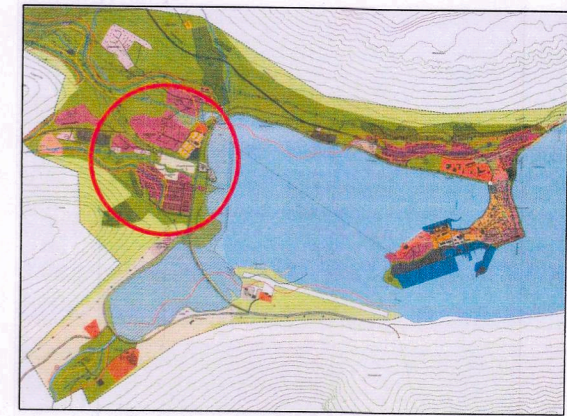
AÐALSKIPULAG ÍSAFJARÐAR 2008-2020