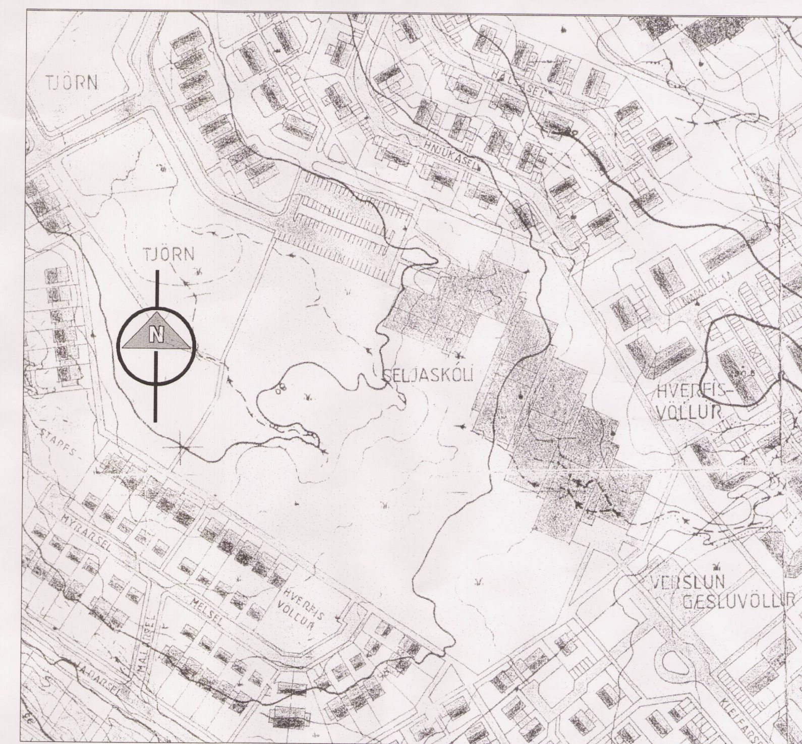
Hluti af deiliskipulag Seljahverfis samþ. í borgarráði 20.12.1977 Uppfært í september 1986 mkv. 1:2000