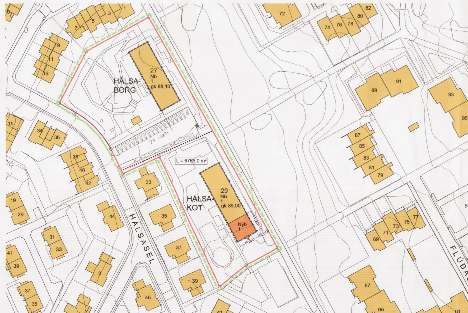
TILLAGA AÐ BREYTTU DEILISKIPULAGI M 1 : 1000