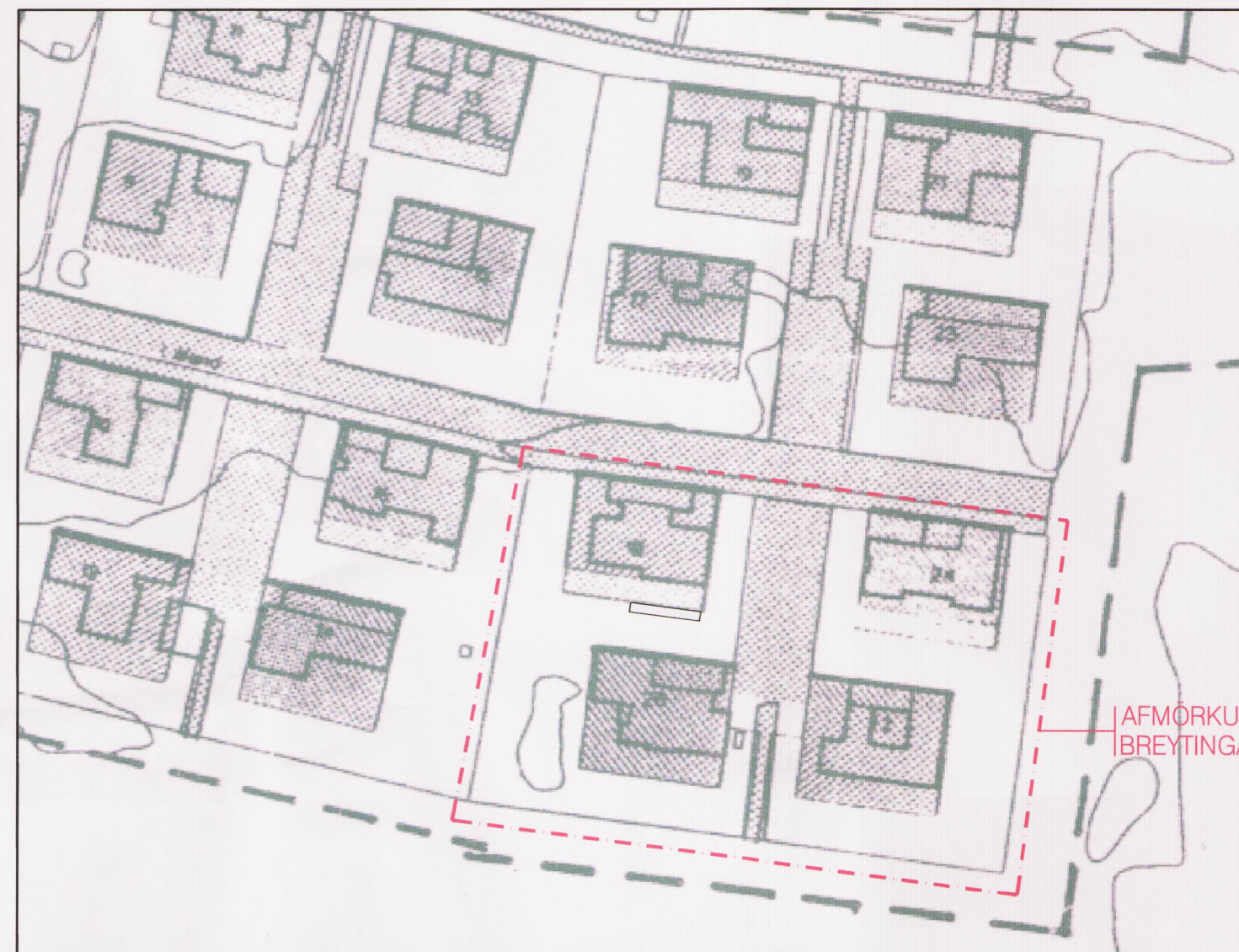
TILLAGA AÐ BREYTINGU Á DEILISKIPULAGI FYRIR LÁLAND 18-24 - VEGNA LÁLANDS 18 1:1000

- Bent er á að ekki verður gerð breyting á lögnum þó kjallarar verði heimilaðir. Eigendur verði að gera ráðstafanir á eigin kostnað kjösi þeir að hafa vatnsrennsli eða vatnssalerni í kjöllurum.