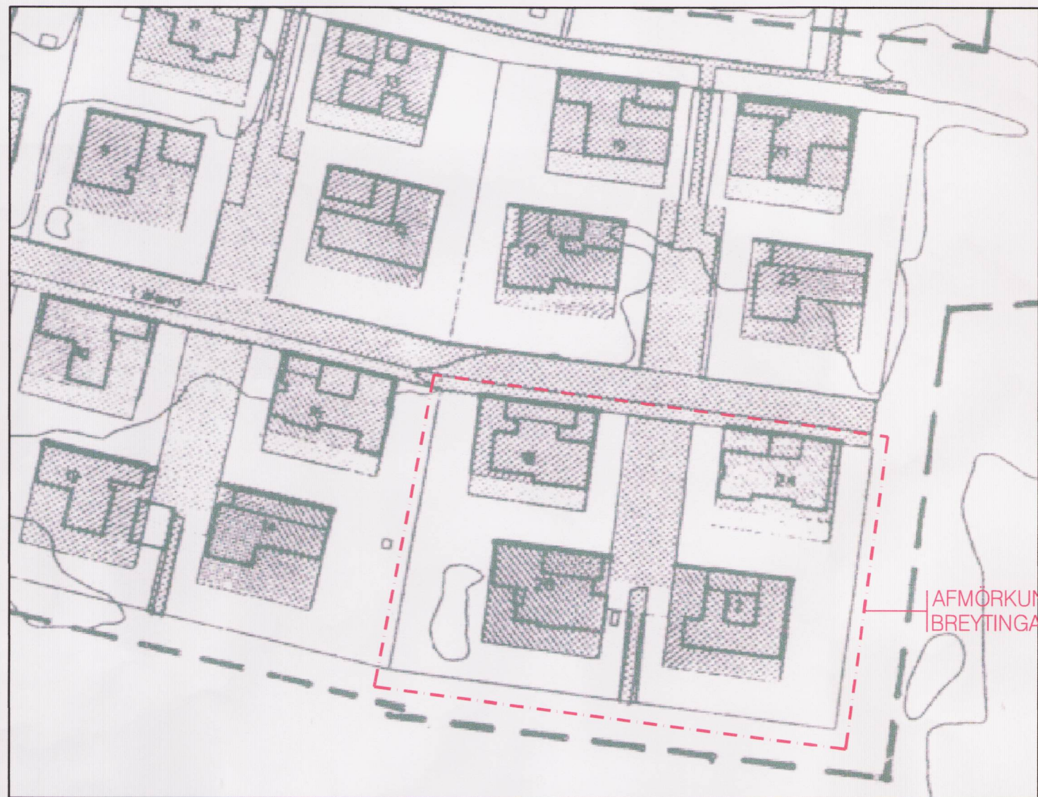
HLUTI AF GILDANDI DEILISKIPULAGI FOSSVOGSHVERFIS - SAMÞYKKT Í BORGARRÁÐI 24.08.1999 1:1000