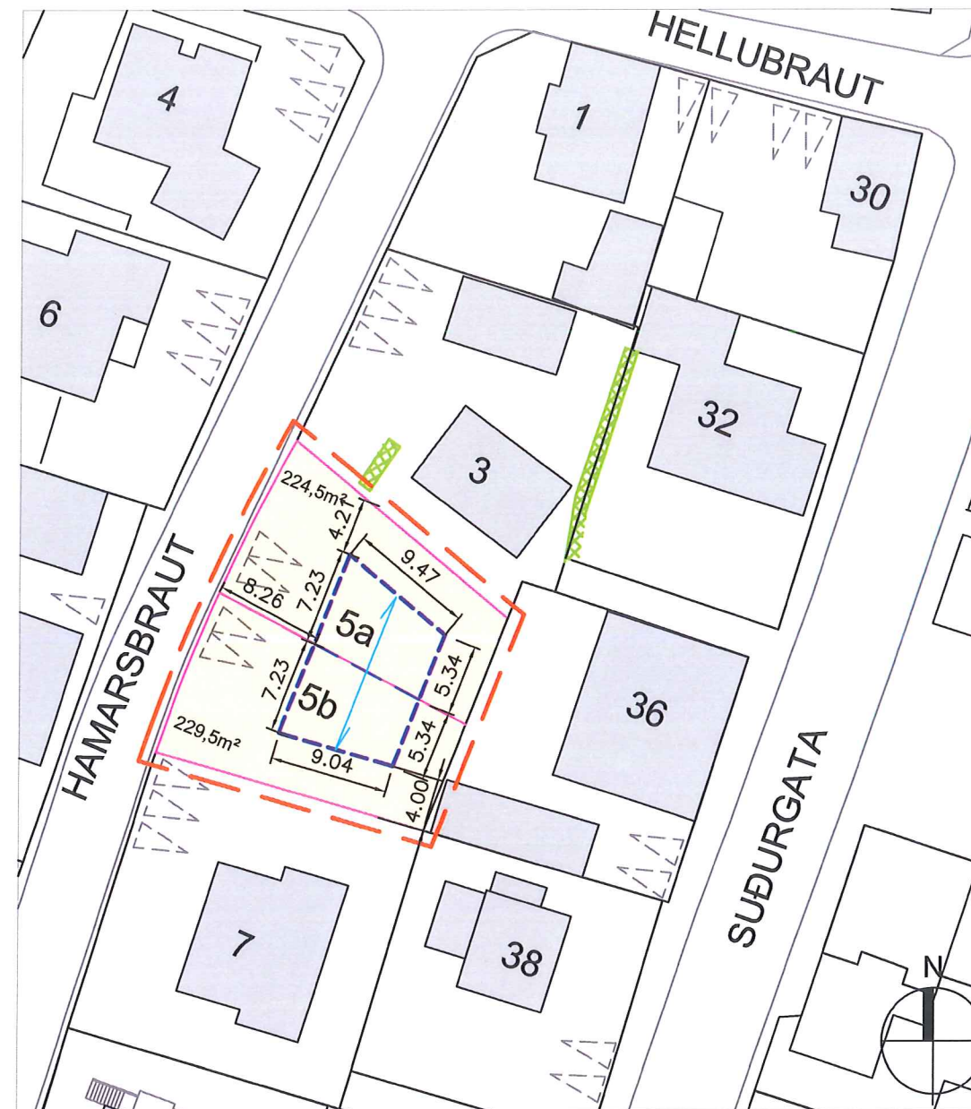
Deiliskipulag við Hamarsbraut 5 mkv. 1:500

Í gildi er deiliskipulag sem samþykkt var á fundi bæjarstjórnar í mars 2011. Á lóðinni er heimilt að byggja einbýlishús á einni hæð með portbyggðu risi innan byggingarreits. Hámarks vegg hæð er 4,9m frá gólfhæð 1. hæðar sbr. hæðarblað. Húsið skal hafa mæni með sömu stefnu og Hamarsbraut og lágmarkspakhalli er 21°. Hámarks mænishæð er 6,9 m. Hámarks nýtingarhlutfall lóðar er 0,45. Lóð er 454m 2 og hámarksbyggingarmagn er 204m 2