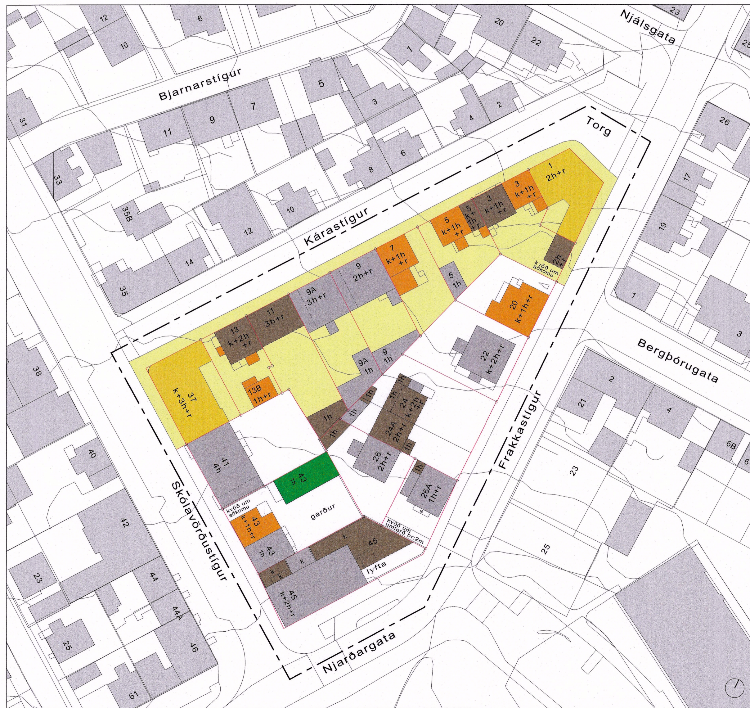
GILDANDI DEILISKIPULAGSUPPRÁTTUR, SAMÞYKKT 4. SEPTEMBER 2008 OG BIRTIST Í B-DEILD 2. DESEMBER 2008 ÁSAMT BREYTINGU Á DEILISKIPULAGI FRAKKASTÍGUR 26 OG 26A, DAGS 6. MAÍ 2016