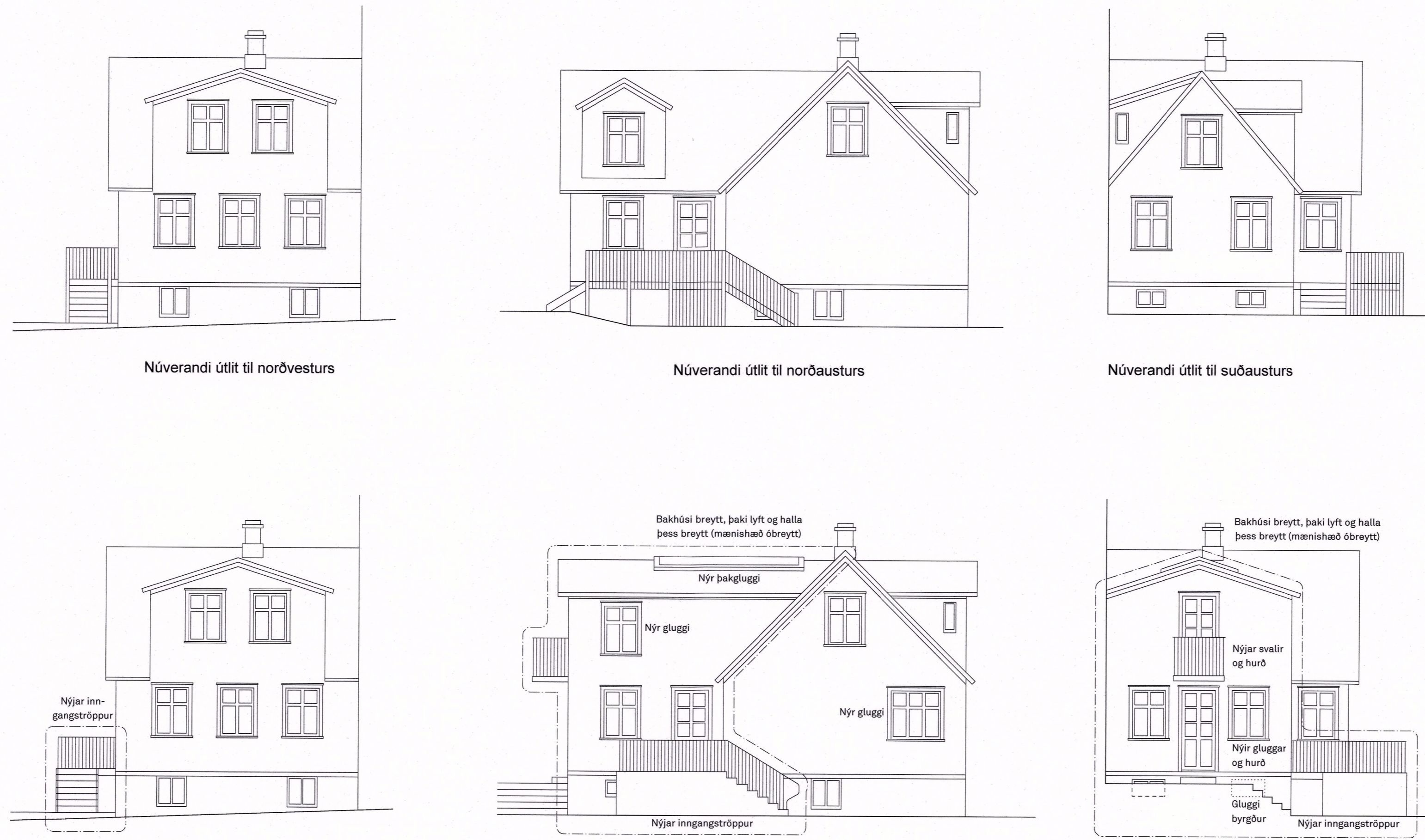
ÚTLITSMYNDIR FYRIR OG EFTIR FYRIRHUGAÐAR BREYTINGAR