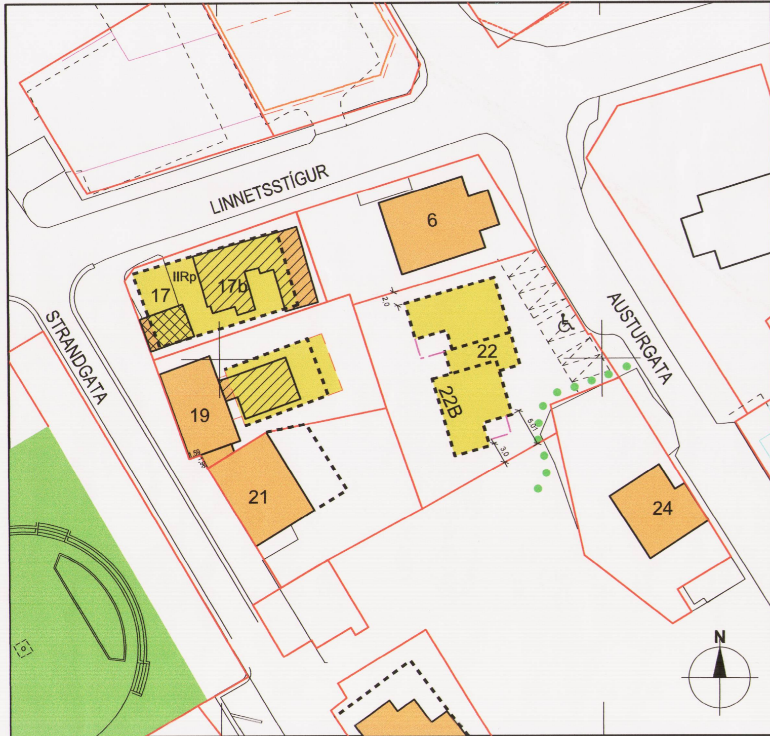
Hluti úr gildandi deiliskipulagi, 1:500 - í gildi frá 19.11.2001

Í skilmálum með gildandi skipulagi segir m.a.: