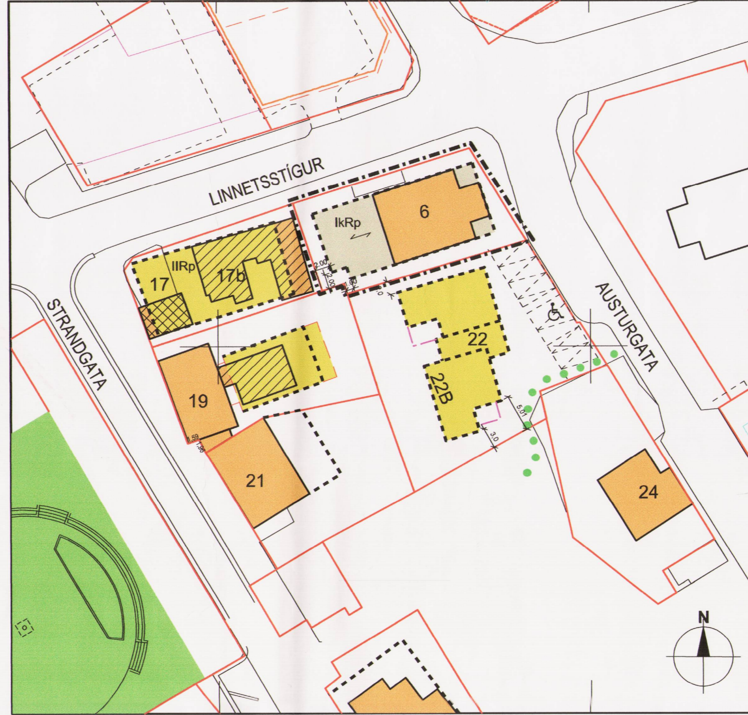
Skipulagsbreyting í sept. 2017, 1:500