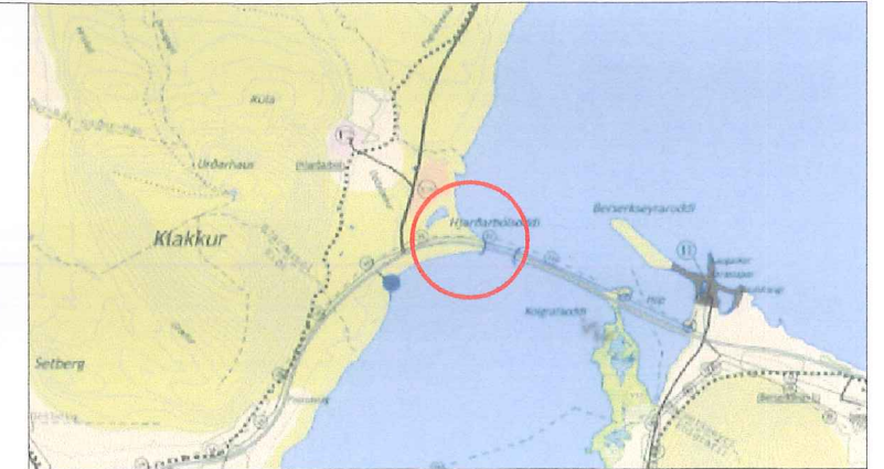
Skýringarmynd: Hluti Aðalskipulags Grundarfjarðar 2003-2015

Deiliskipulag er sett fram á uppdrætti þessum ásamt meðfylgjandi greinargerð og skipulagsskilmálum dags. 18. maí 2018.