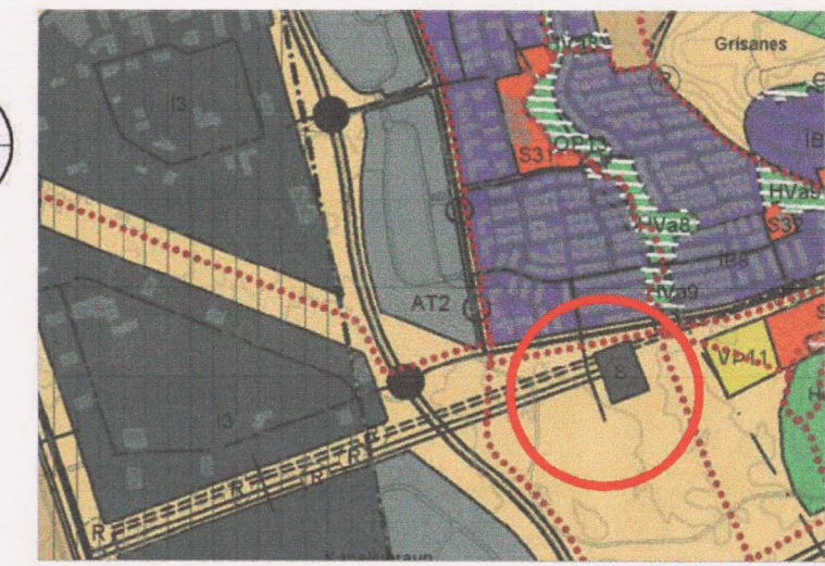
YFIRLIT- Hluti aðalskipulags Hafnarfjarðar 2013-2025