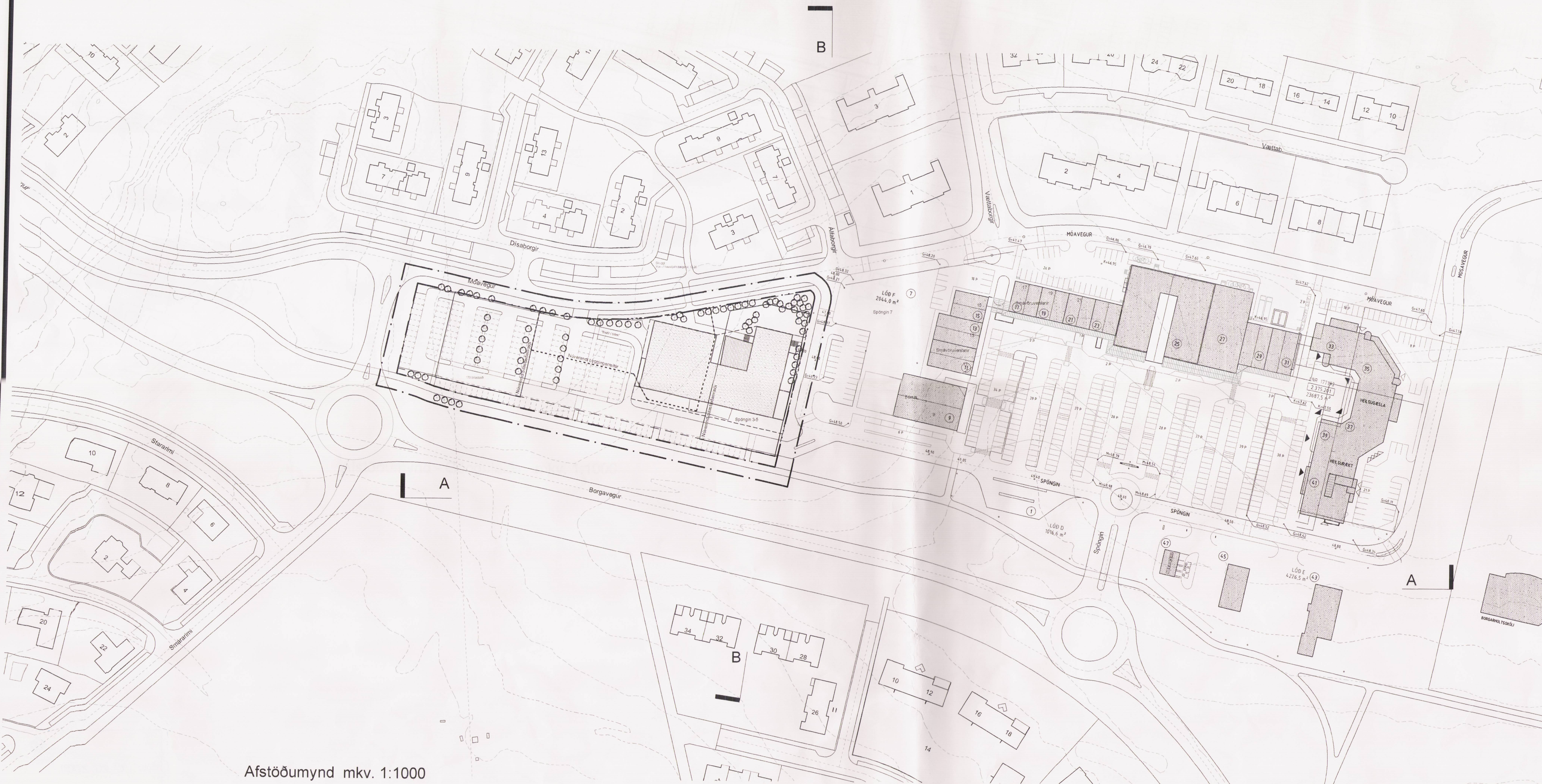
Afstöðumynd mkv. 1:1000