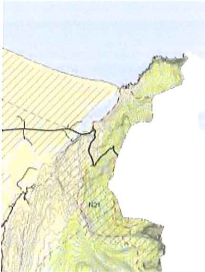
Staðfestur uppdráttur, fyrir breytingu

Hluti af sveitarfélagsuppdrætti A, 1:150.000, fyrir og eftir breytingu: