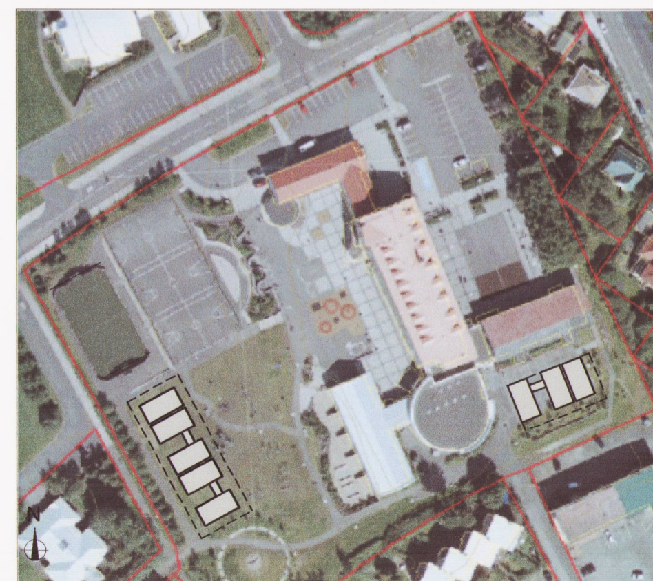
Skýringarmynd - loftmynd