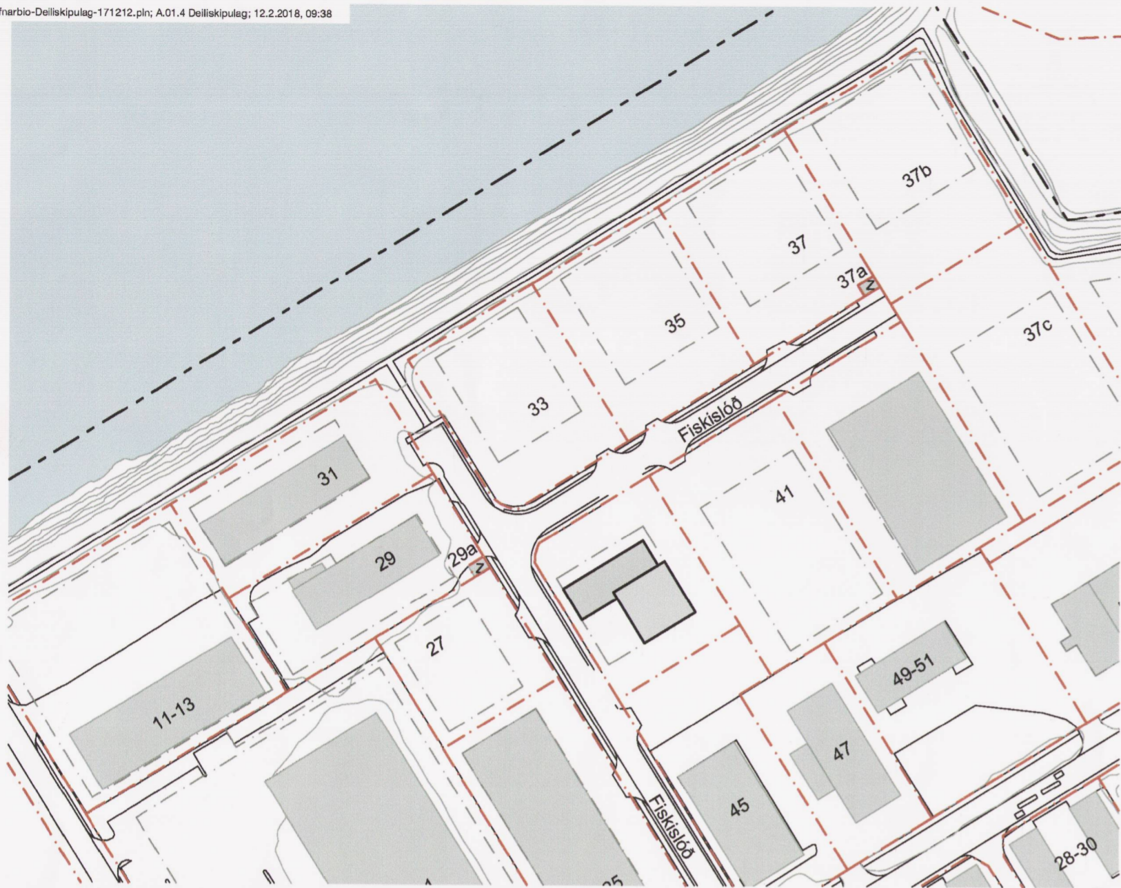
GILDANDI DEILISKIPULAG - 1 : 2.000 Samþykkt í Borgarráði 27. Janúar 2016.