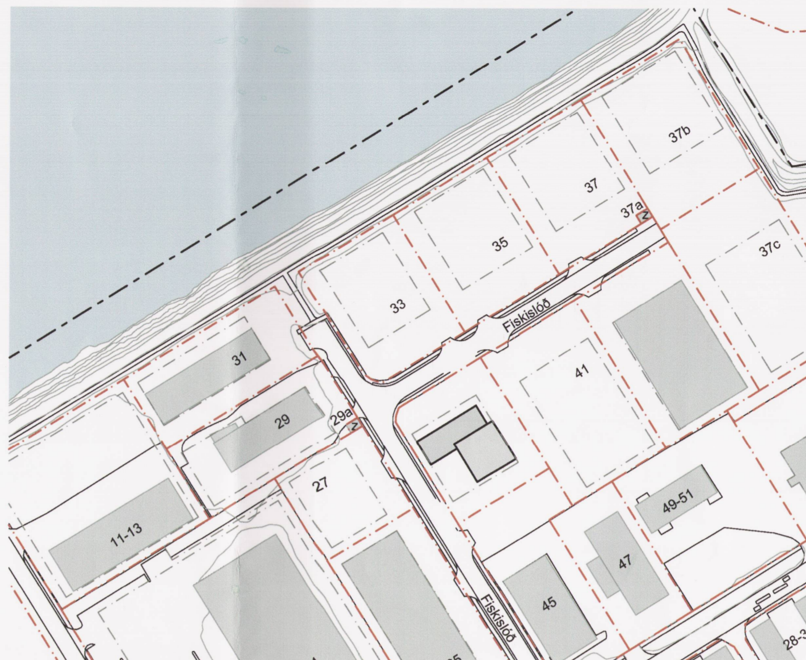
TILLAGA AÐ BREYTINGU Á DEILISKIPULAGI - 1 : 2.000

Um er að ræða 18 metra háan, sérútbúinn sýningarsal auk móttökuskála sem afmarkast af gildandi ákvæðum um hámarkshæð. Unnið verður sérstaklega með útlit á sýningarhúsinu þar sem flöturinn er mjög stór. T.d. með videoverki eða gróðurverki.