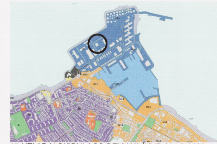
HLUTI AÐALSKIPULAGS REYKJAVÍKUR 2010-2030 (EKKI Í KVARÐA)

Að öðru leyti eiga ákvæði úr gildandi deiliskipulagi enn við.