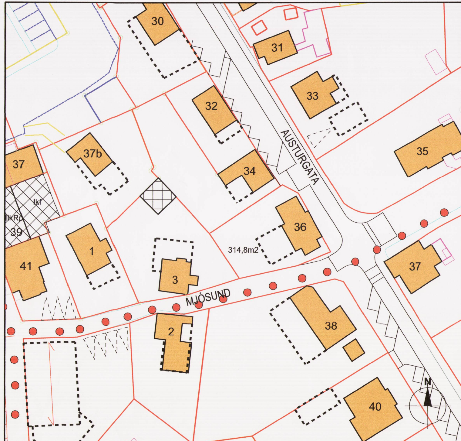
Hluti úr gildandi deiliskipulagi, 1:500 - í gildi frá 19.11.2001

Í skilmálum með gildandi skipulagi segir m.a.: