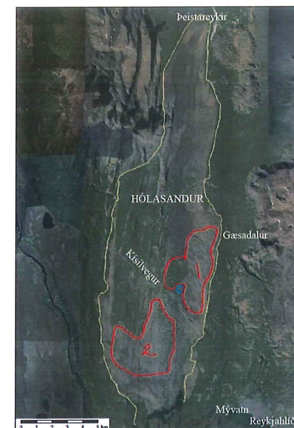
Skýringarmynd. Drög að afmörkun uppgræðslusvæða á Hólasandi.

einbreiður með útskotum. Breytt vegamót við Kísilveg bæta umferðaröryggi á veginum en gamla slóðanum verður lokað. Breyttur aðkomuvegur tengist gömlum vegslóða sem liggur áfram austur í Gæsadal.