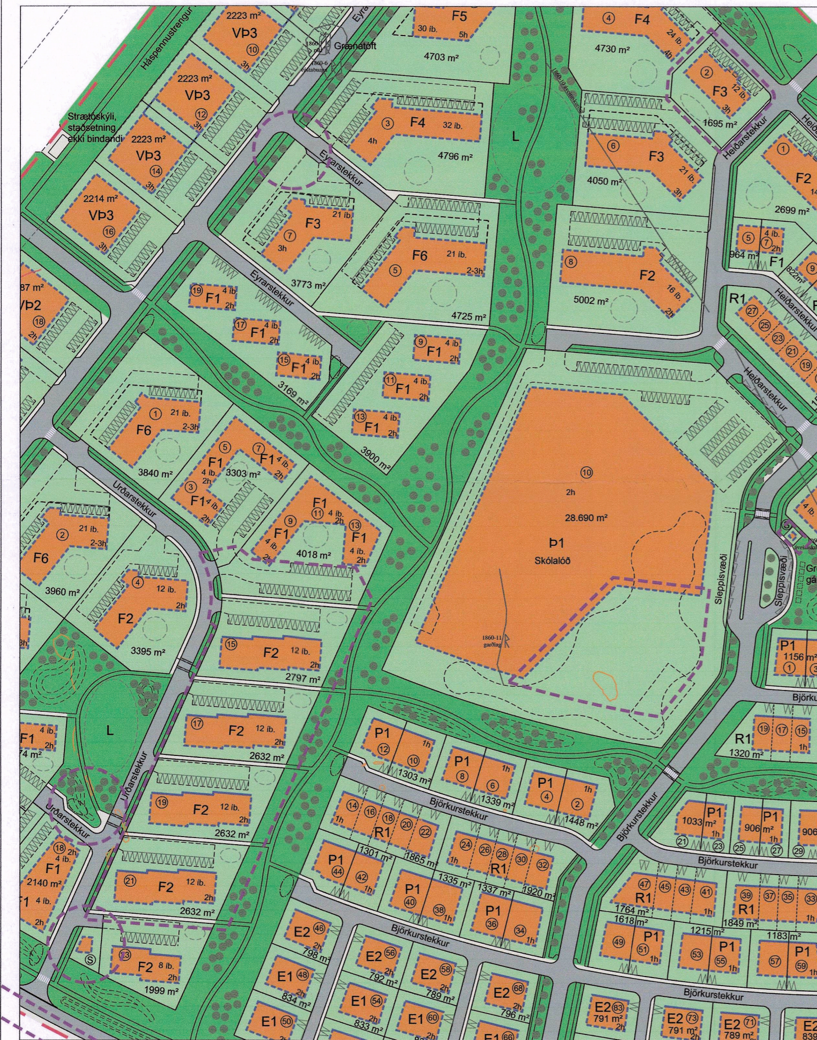
Gildandi skipulag, mkv. 1:2000