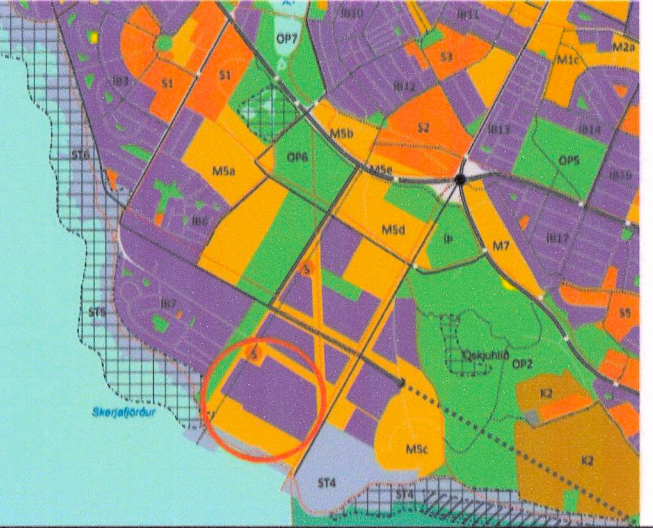
Aðalskipulag Reykjavíkur 2010-2030

Áfangi 1, reitir 1-12 og 16-17. STGR. 0-1-1668, 0-1-1680