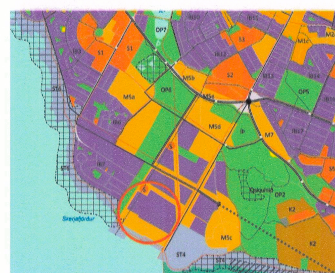
Aðalskipulag Reykjavíkur 2010-2030

Áfangi 1, reitir 1-12 og 16-17. STGR. 0-1-1668, 0-1-1680