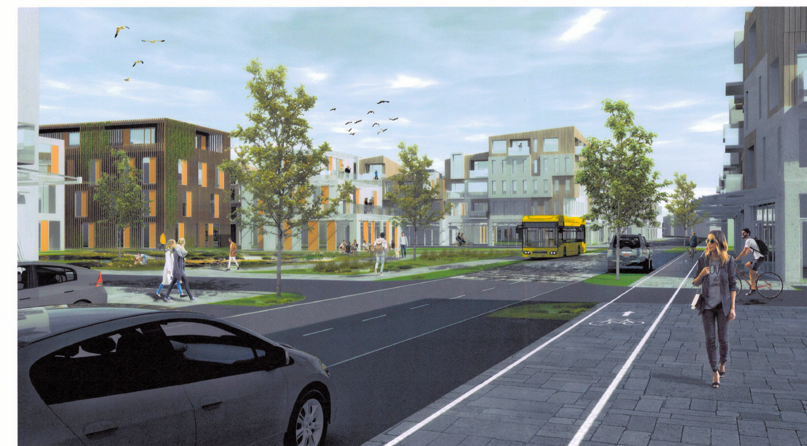
Torg og borgargata