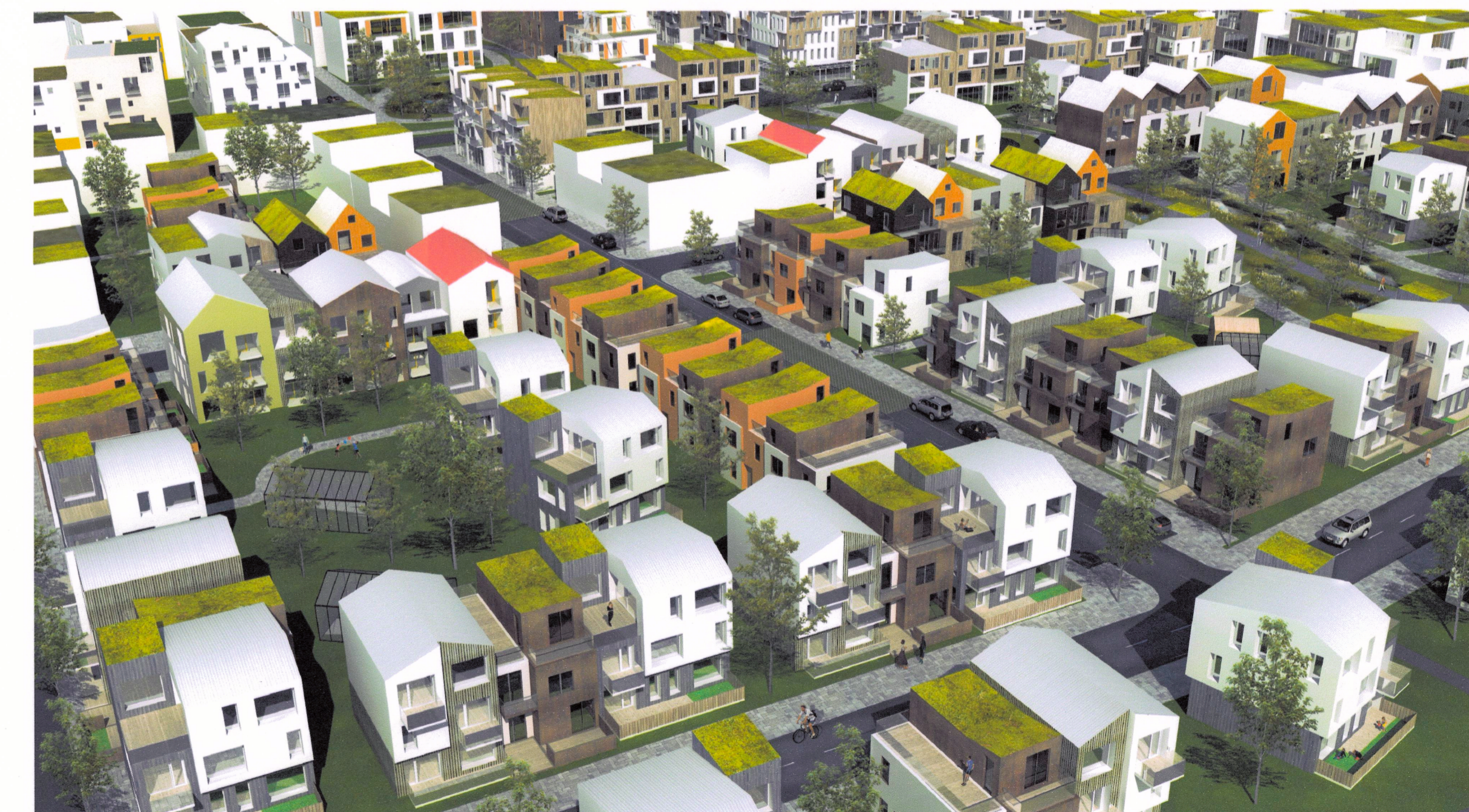
Randbyggð með húsum í inngörðum

Deiliskipulag þetta sem fengið hefur meirafétt í samræmi við ákvæði 1. mgr. 41. gr. séðskilgagla nr. 232010 var samþykkt í Skýringuuppdráttum þann 22. mars 2021 og í Leiguskiptum þann 20. apríl 2021. Tiltækt var auglýst frá 16. apríl 2021 með skýringuuppdráttum og 2. nóvember 2021.