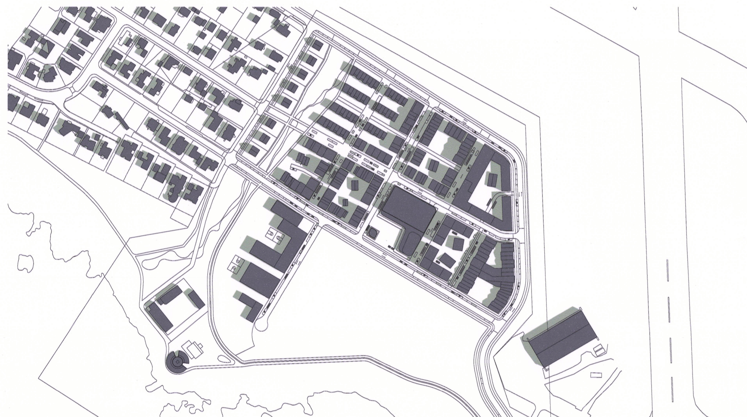
21. júní kl. 09:00