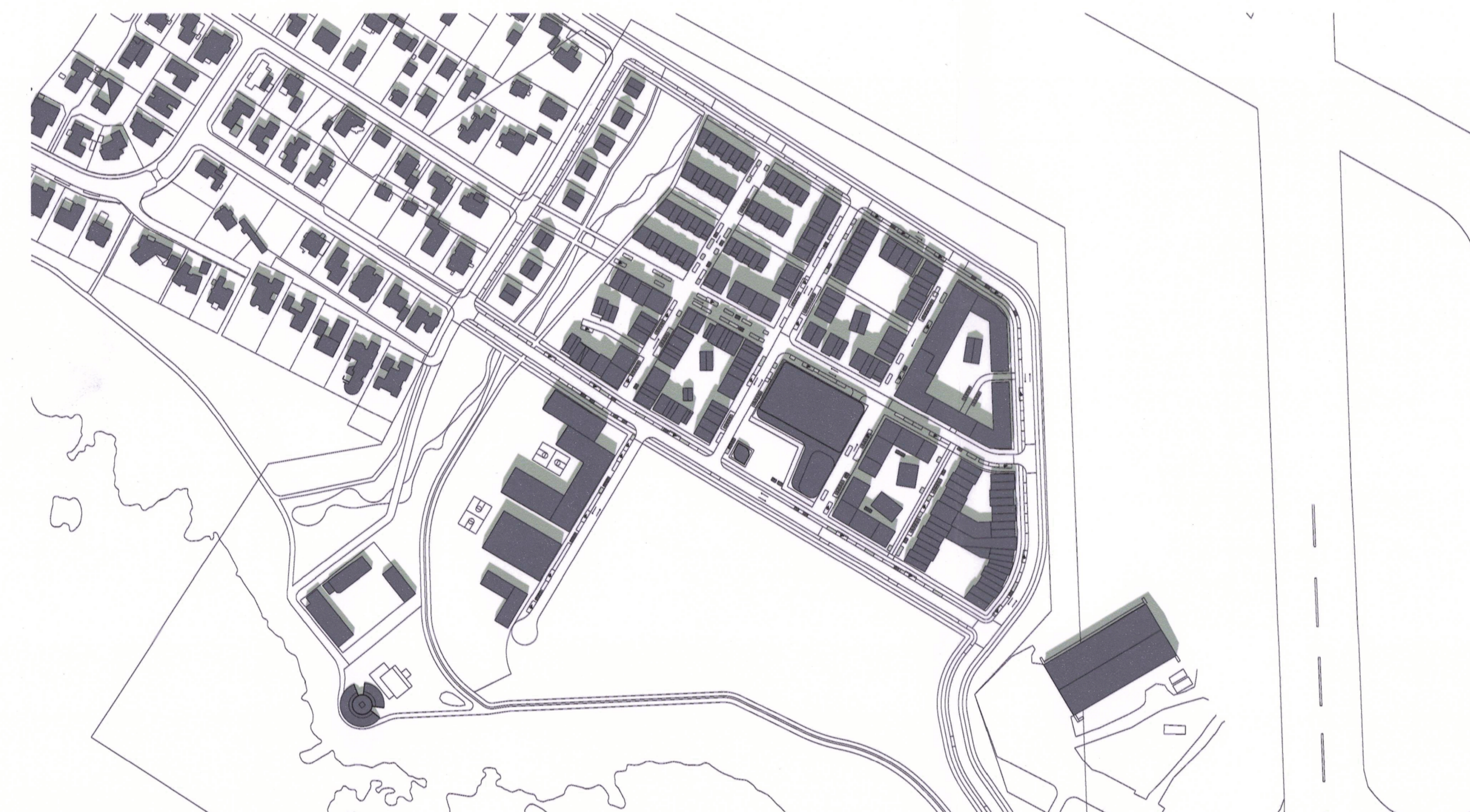
21. júní kl. 13:00