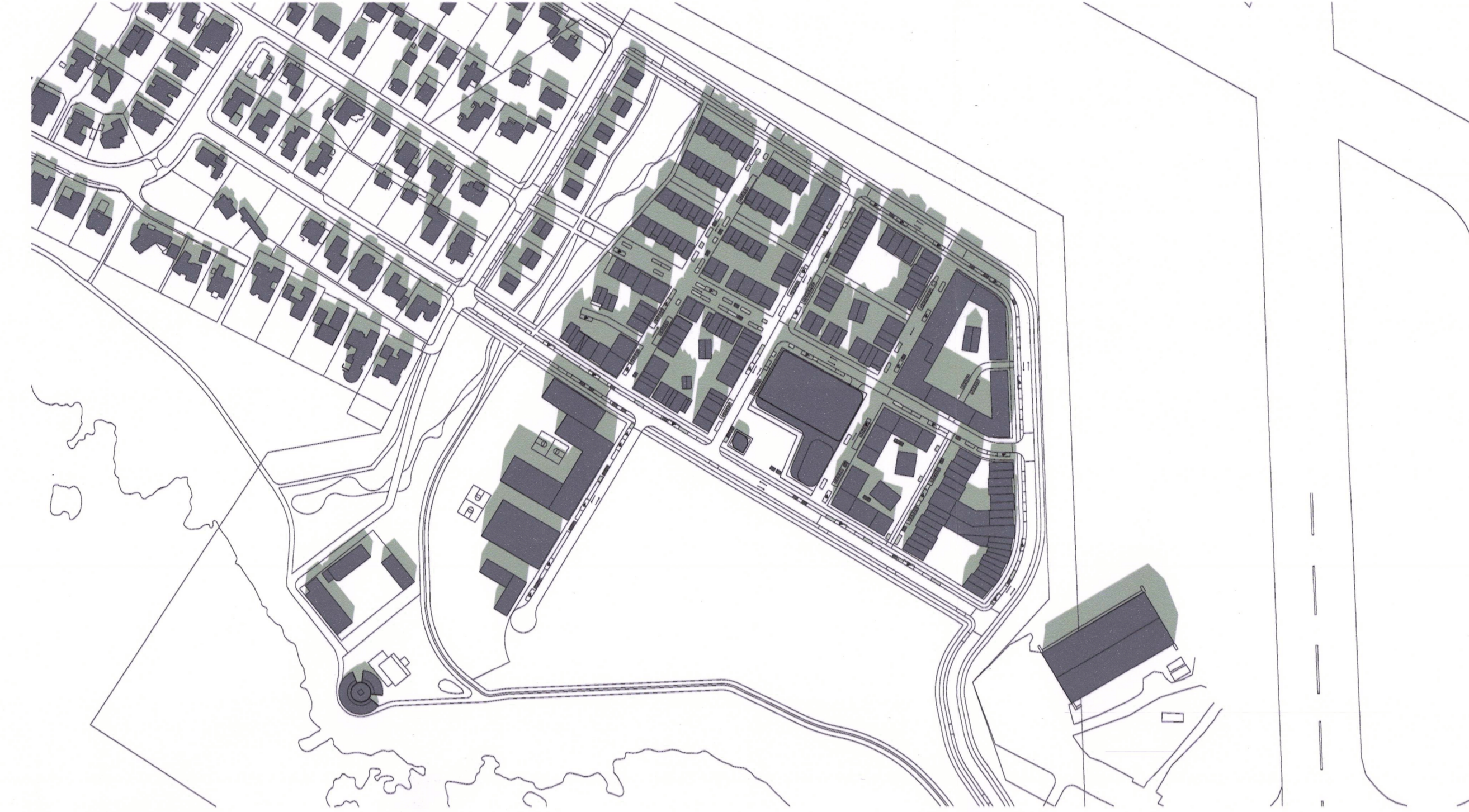
21. mars kl. 13:00