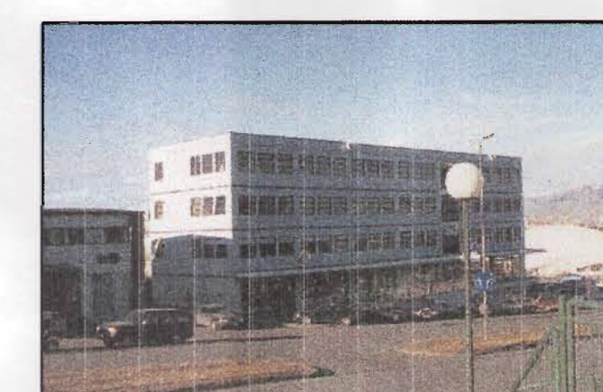
Vegmúli 2 Suðurlandsbraut 16, Vegmúli 2, Vegmúli 4 og Ármúli 13 A eru á sömu lóðinni. Skilmálar

Flatarmál lóðar: 7.790 m 2 Nýtingarhlutfall á lóð án bilageymslu N: 1,4 með bilageymslu N: 1,5. Byggingarmagn u.p.b. 10.773 m 2 án bilageymslu. Bilastæði u.p.b. 196 stæði á lóð. 1 stæði fyrir hverja 35 m 2 í nýbyggingu.