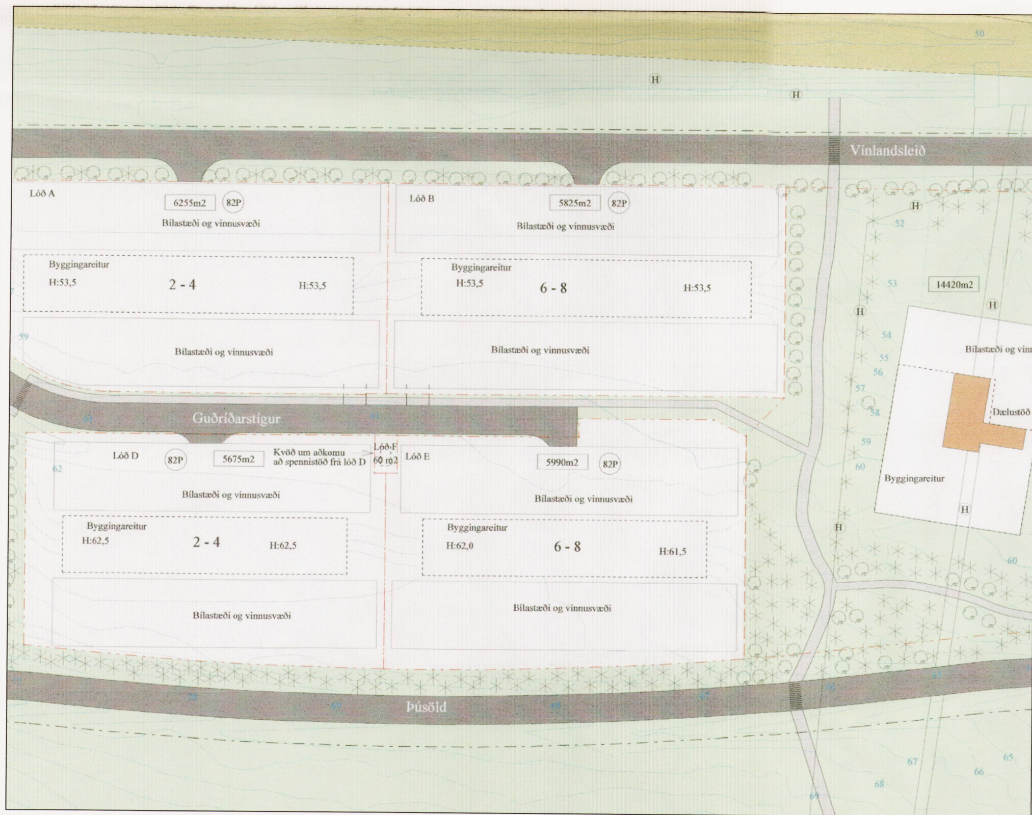
Gildandi deiliskipulag 1:1000

samþykkt í borgarráði: 08. febrúar 2000 breytt: 31. júlí 2001