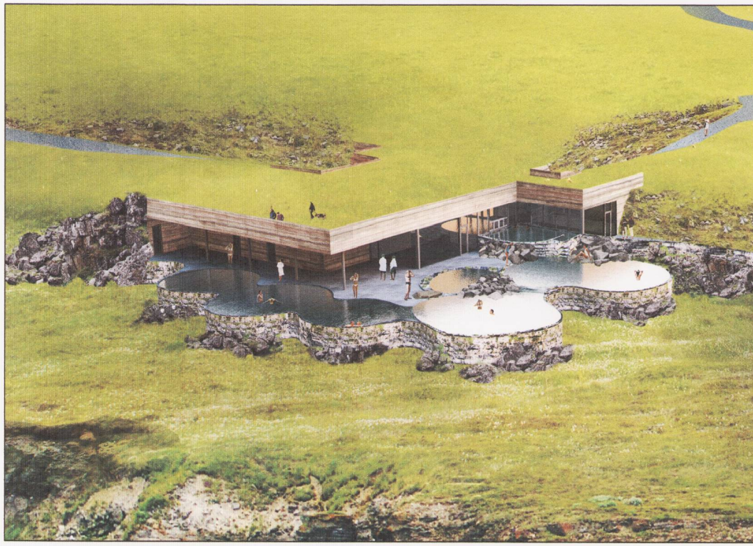
Tillaga að legu sjóbaða í landinu.