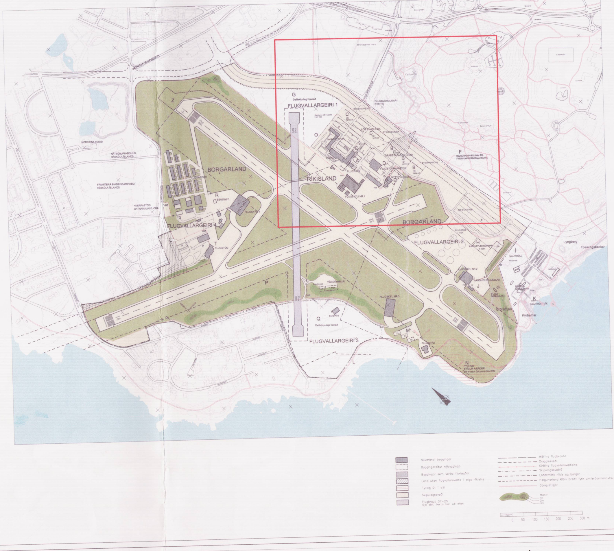
GILDANDI DEILISKIPULAG REYKJAVÍKURFLUGVALLAR, dags. 15. júní 1999 (smækkaður uppdráttur)