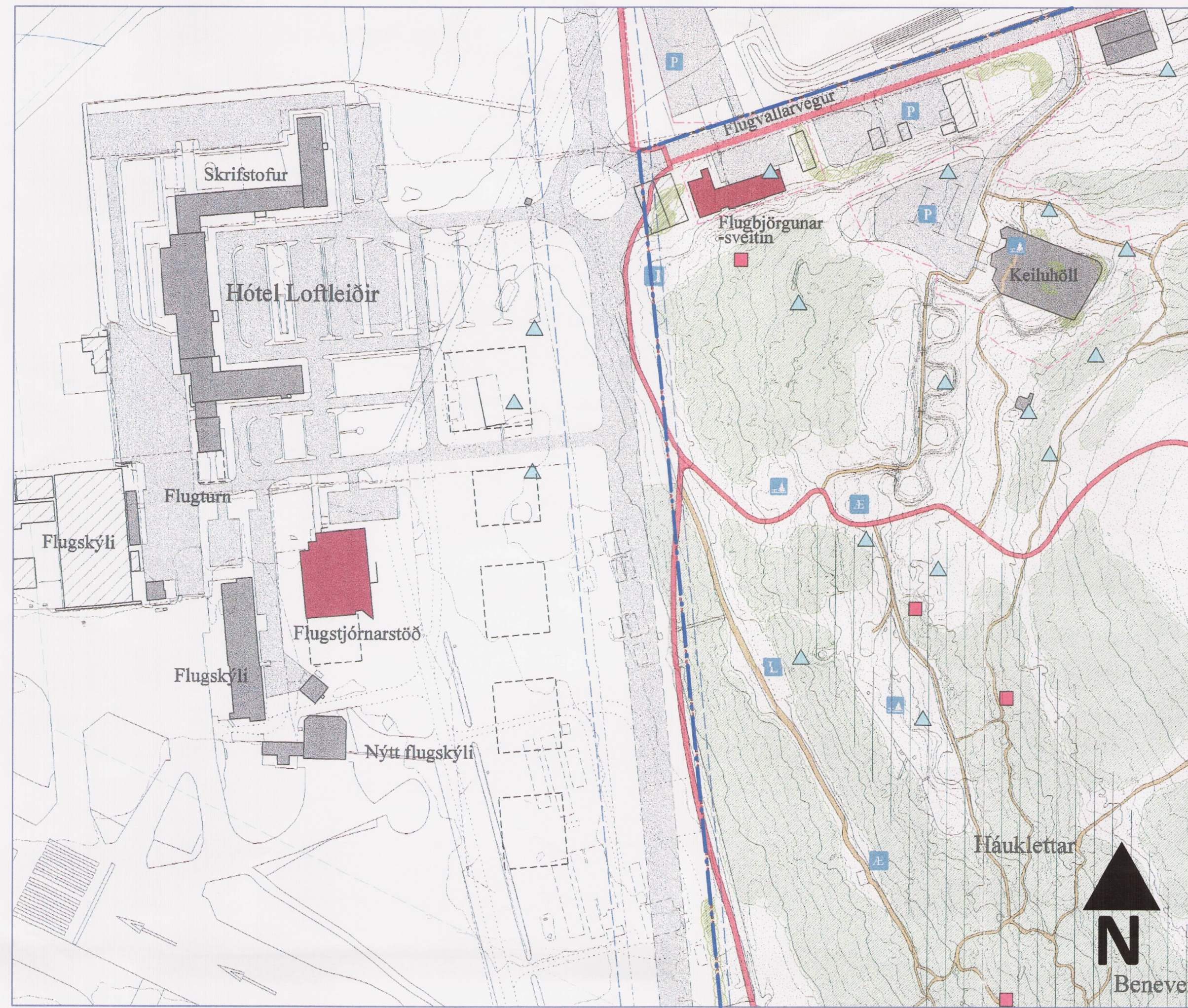
HLUTI AF GILDANDI DEILISKIPULAGI ÖSKJUHLÍÐAR, dags. 1. júní 1999, mkv. 1:2000