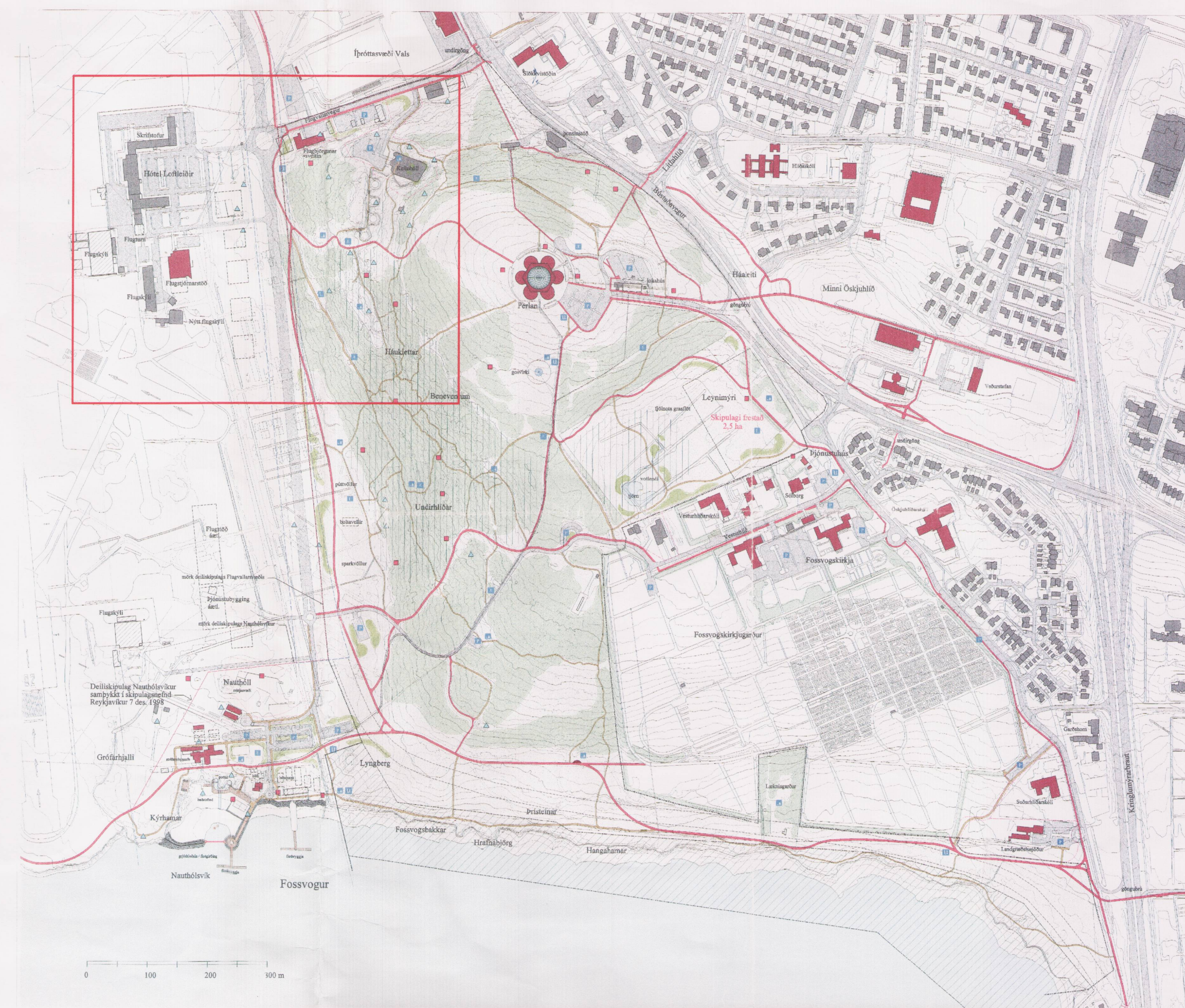
GILDANDI DEILISKIPULAG ÖSKJUHLÍÐAR, dags. 1. júní 1999, (smækkaður uppdráttur)