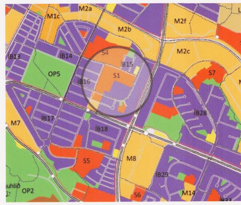
Hluti aðalskipulags Reykjavíkur 2010-2030