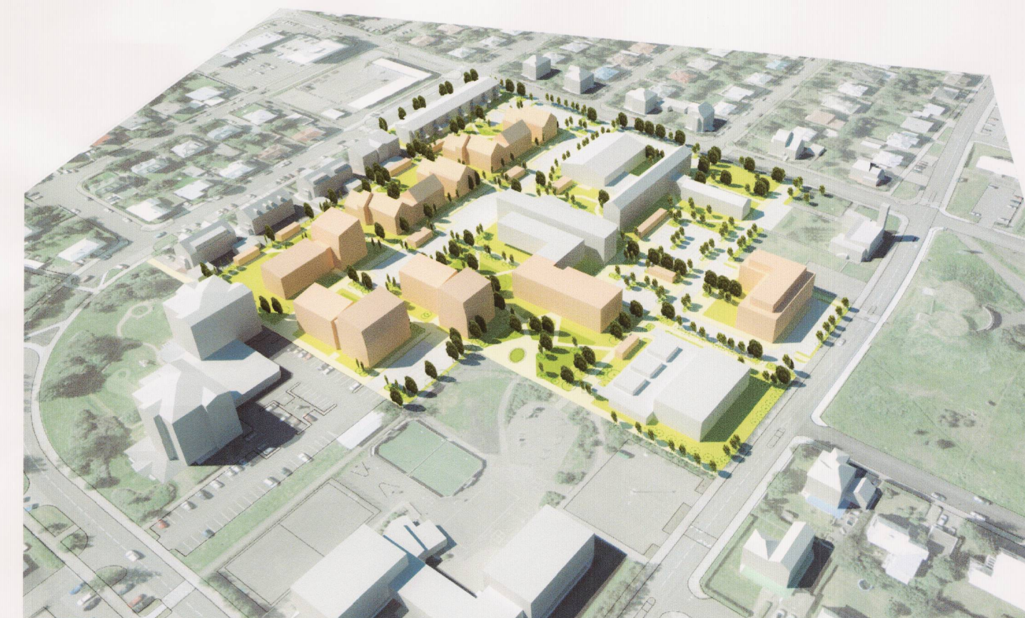
Skipulagssvæði, fjarvíddarmynd frá norðaustri