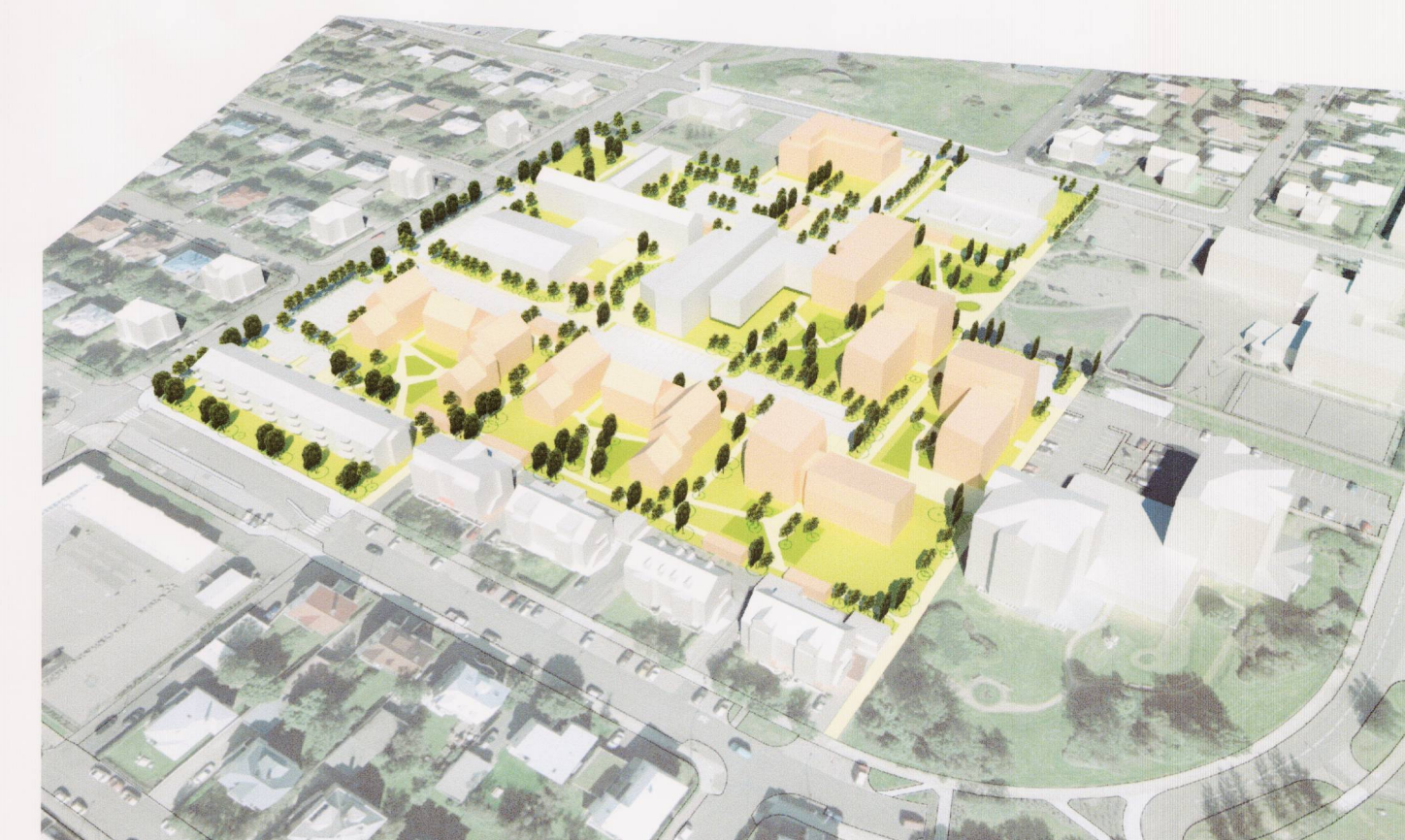
Skipulagssvæði, fjarvíddarmynd frá suðaustri