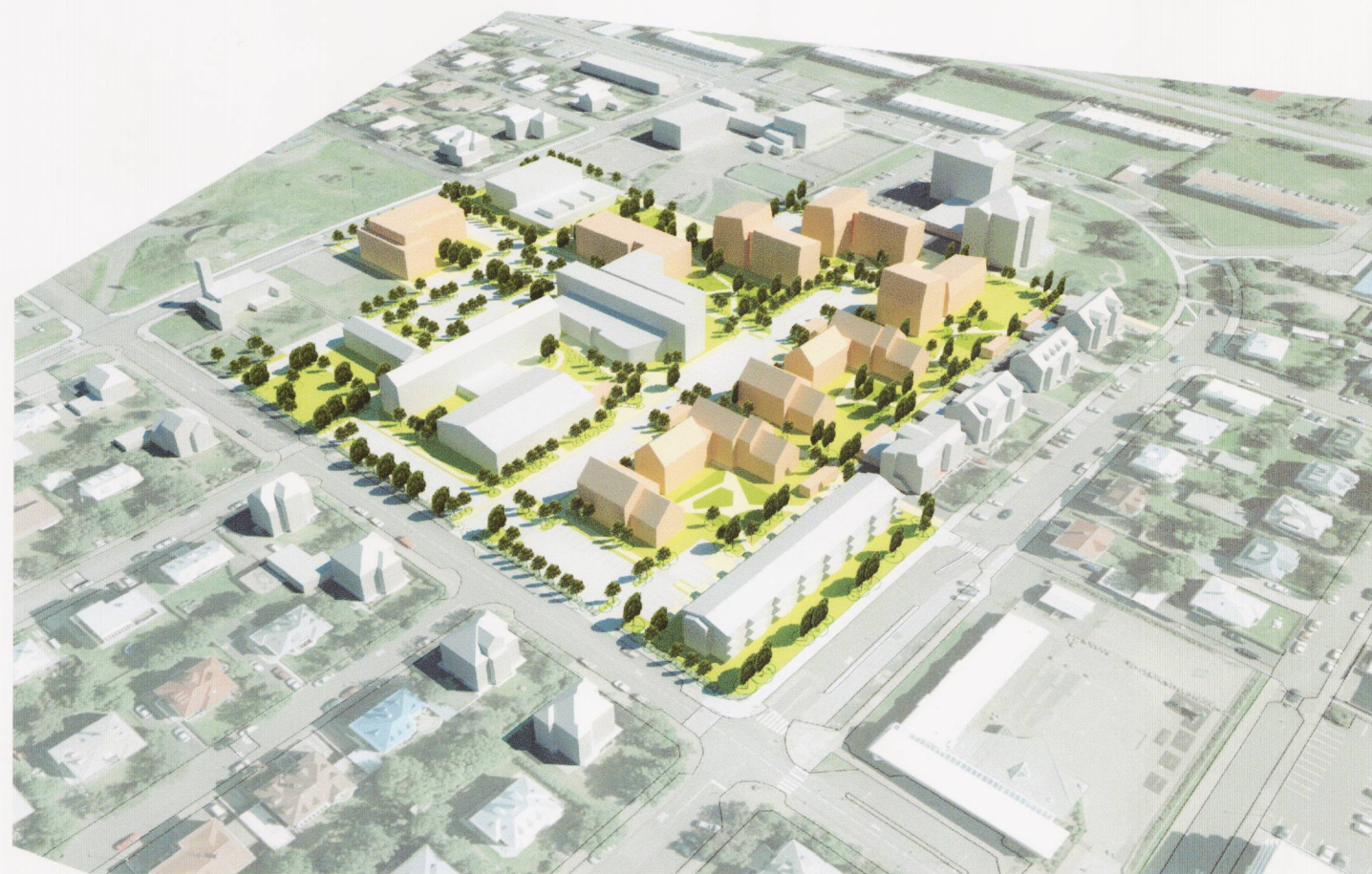
Skipulagssvæði, fjarvíddarmynd frá suðvestri