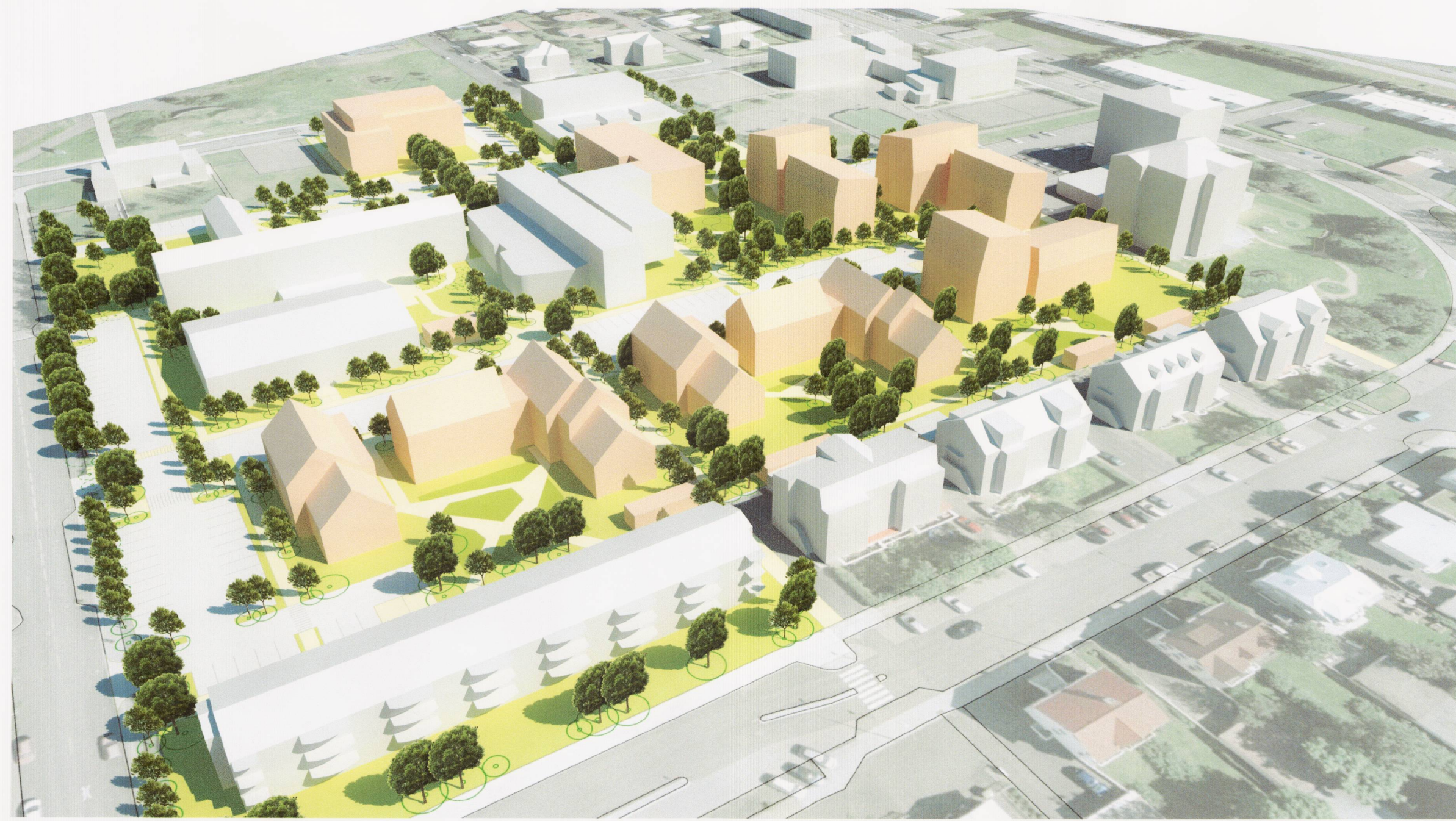
Skipulagssvæði, fjarvíddarmynd frá suðri