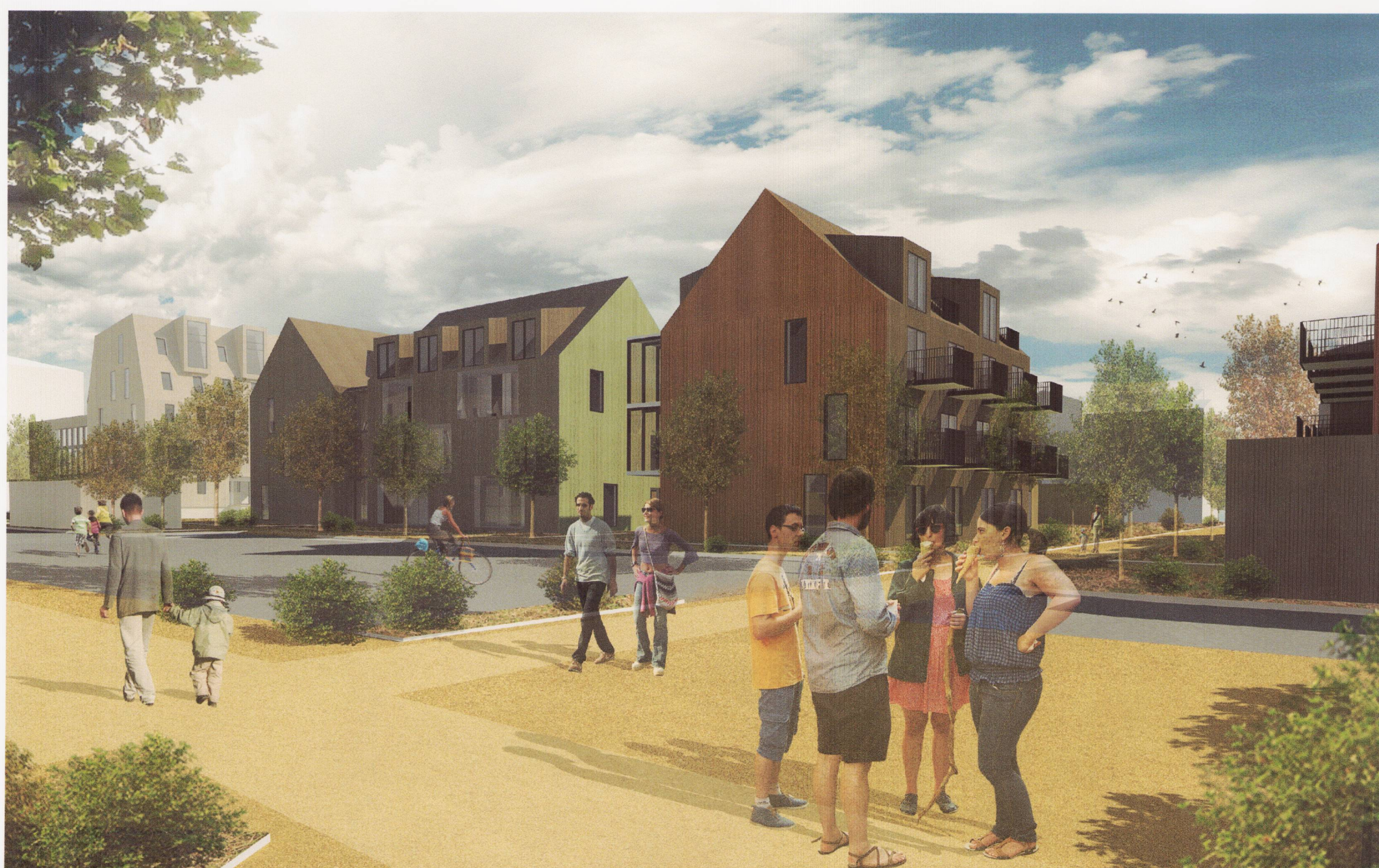
Reitur A og B, fjarvíddarmynd frá noðri