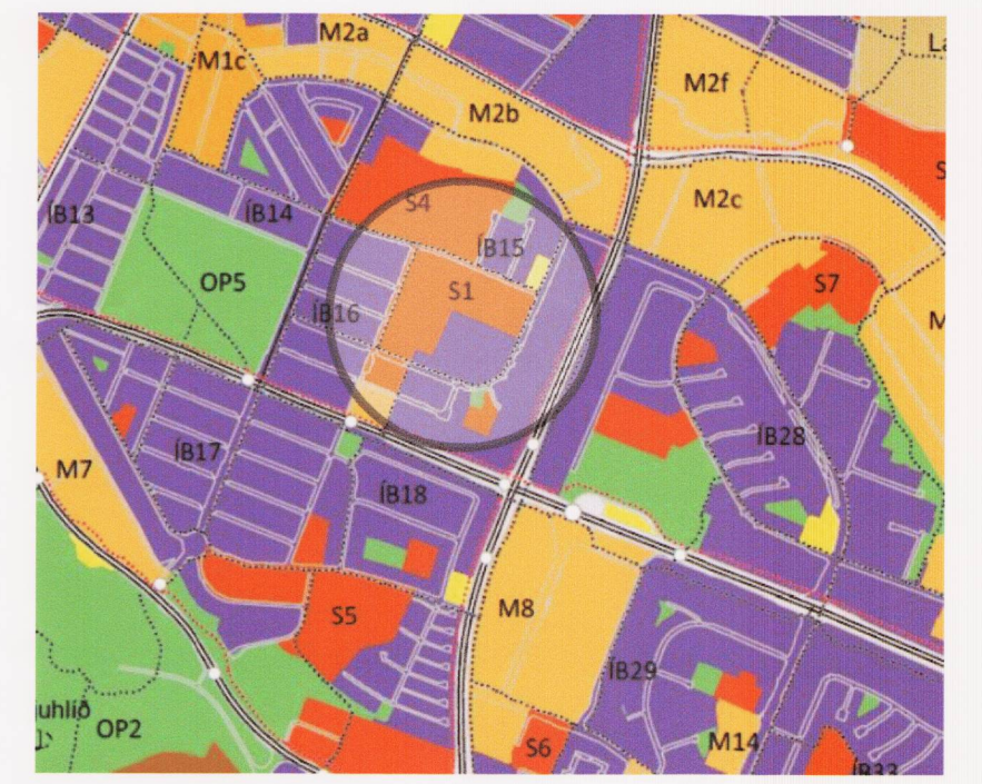
Hluti aðalskipulags Reykjavíkur 2010-2030