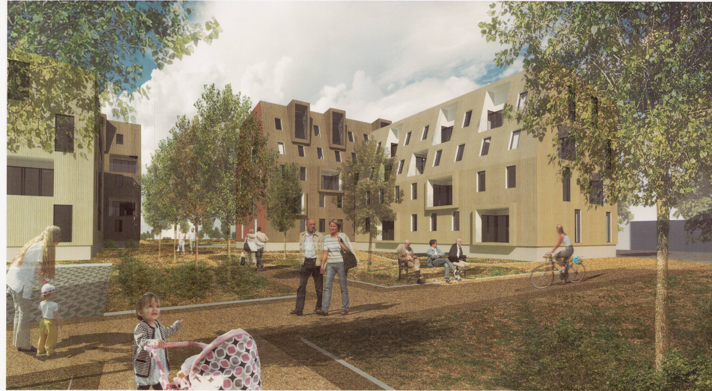
Reitur C, fjarvíddarmynd frá suðri