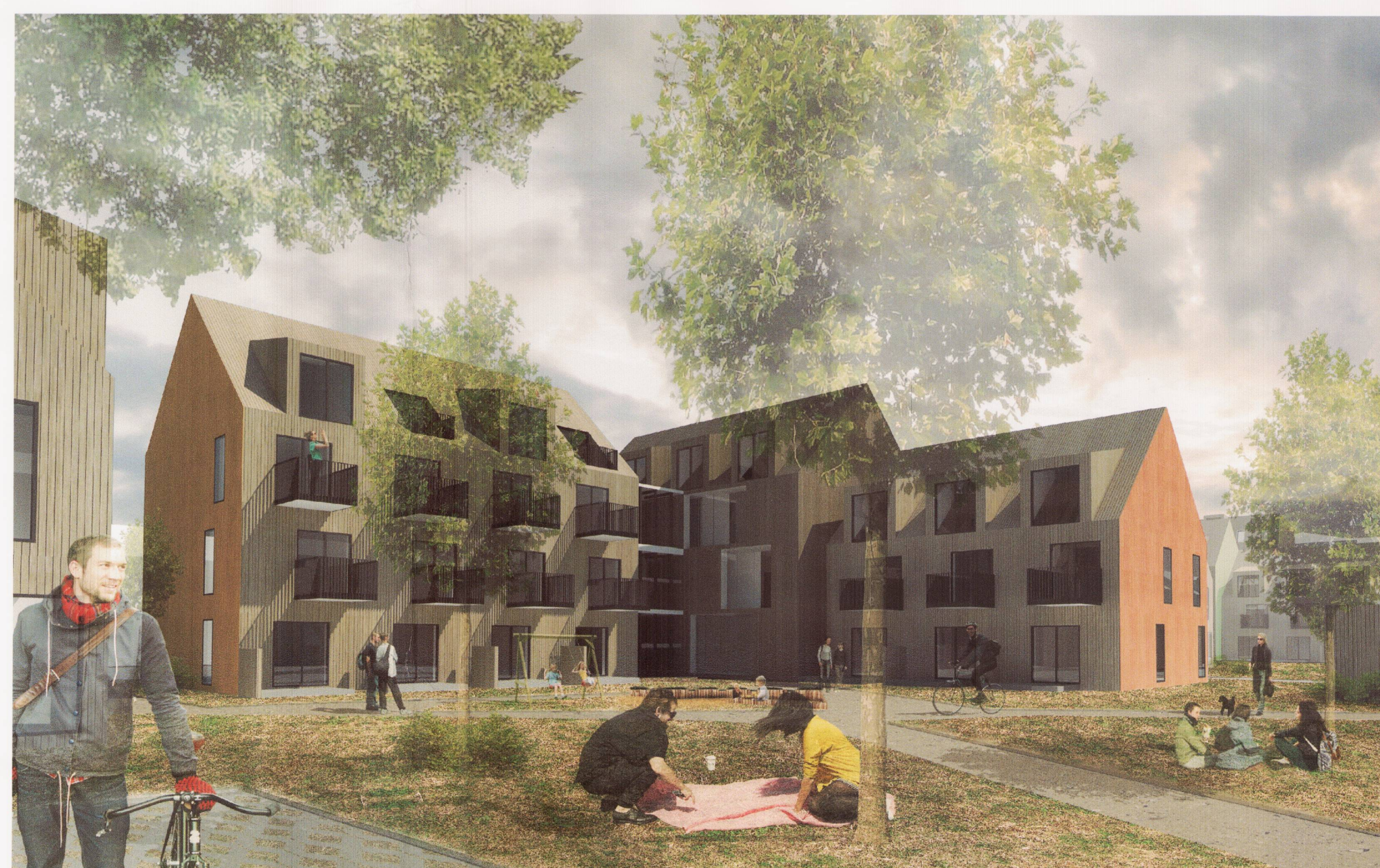
Reitur A og B, fjarvíddarmynd frá suðri

Deiliskipulagsbreyting þessi sem fengið hefur meðferð í samræmi við ákvæði 1. mgr. 43. gr. skipulagslaga nr. 123/2010 var samþykkt í Umhverfis- og skipulagsráði þann 14. júní 2017 og í Byggingaráði þann 22. júní 2017. Tillagan var auglýst frá 10. apríl 2017 með athugasemdafresti til 22. maí 2017.