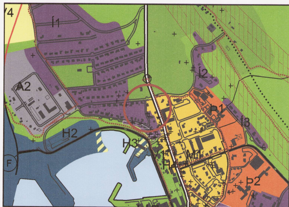
Tillaga að breytingu, 1:10.000

svæðinu undir starfsmenn sem koma til styttri dvalar t.d. í tengslum við sláturtíð eða vinnu við uppbyggingu á Bakka. Í nýlegri húsnæðisgreiningu vegna uppbyggingarinnar við Bakka kom einmitt í ljós að mikil þörf er á minni leigubúðum bæði eins og tveggja herbergja og getur gistiheimilið komið inn sem góður kostur fyrir tímabundið aðsetur starfsmanna.