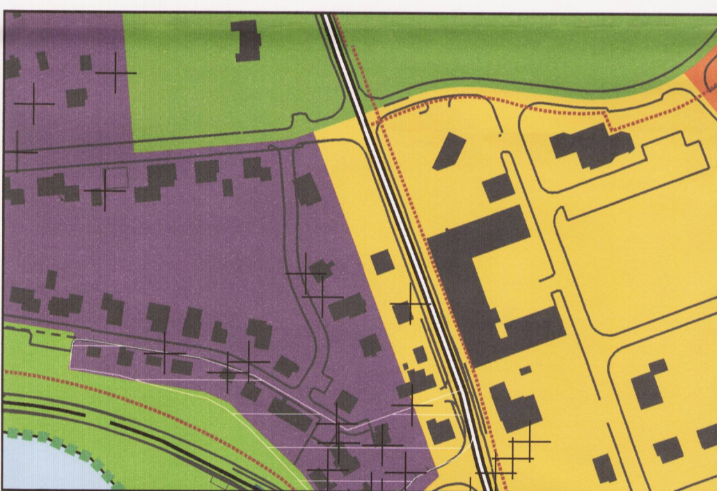
Skýringarmynd: Hluti úr Aðalskipulagi Norðurlands 2010-2030 (m.s.br.) í mkv. 1:2500