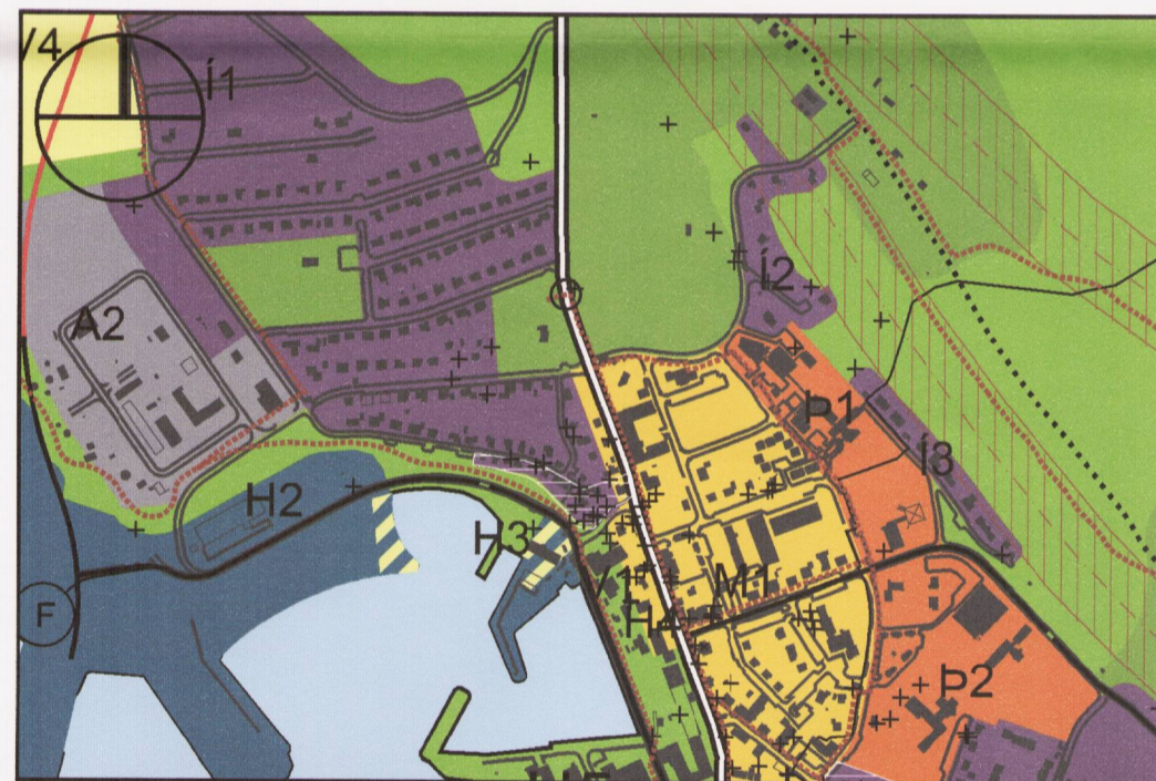
Aðalskipulag Norðurlands 2010-2030 m.s.br. / Húsavík, 1:10.000

Fyrir eru í samþykktu deiliskipulagi áform um uppbygging gistaða á Húsavíkurhöfða með allt að 60 herbergjum skv. aðalskipulagi. Eins var í vinnslu fyrir nokkrum árum deiliskipulag fyrir golvöllinn sem gerði ráð fyrir uppbyggingu hótels en sú vinna var ekki klárð, en þar er í gildi staðfest aðalskipulag sem gerir ráð fyrir að þar verði byggt hótél. Reiknað er með að gestir á þessum stöðum muni að tölveruð leyti tengjast þeirri afþreyingu sem þar er, það er baðstað og golfi. Markhópur gistiheimilisins við Héðinsbraut eru hins vegar almennir ferðamenn auk þess sem ætlinn er að gistaðastaðan muni nýstast fyrirtækjum á