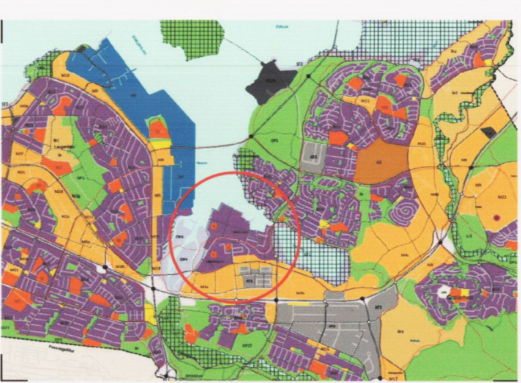
Aðalskipulag Reykjavíkur 2010 - 2030

Deiliskipulag þetta sem fengið hefur meðferð í samræmi í samræmi við ákvæði 41. gr skipulagslaga nr. 123/2010 var samþykkt í skipulags- og samgöngugæðingaráðgjafi þann 22.8.2018 og í borgarráði þann 30.8.2018.