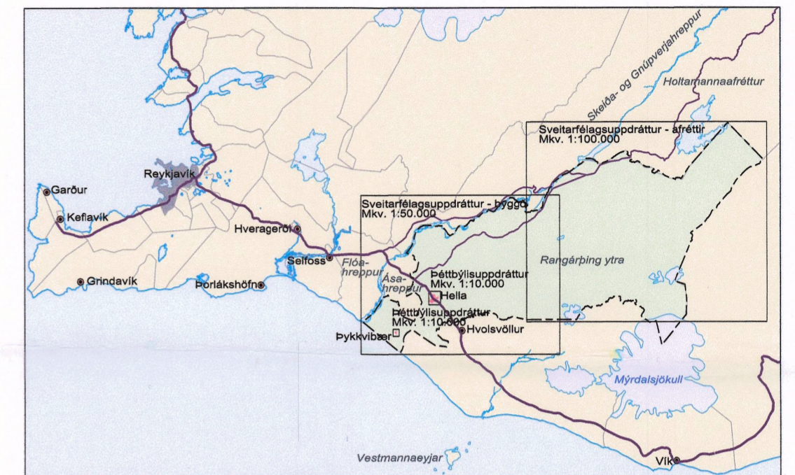
Afstöðumynd í mkv, 1:1.500.000.