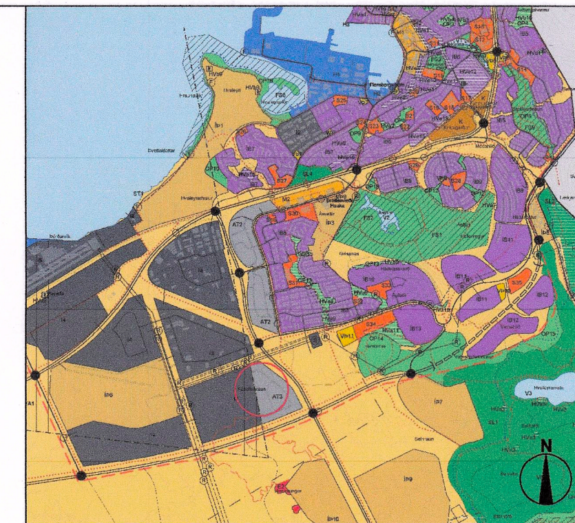
YFIRLIT - HLUTI AÐALSKIPULAGS HAFNARFJARÐAR 2013 - 2025

Samkvæmt deiliskipulagsbreytingu er byggingarreitur 24m² fyrir dælustöð, auk þess er gert ráð fyrir aðkomu á lóð.