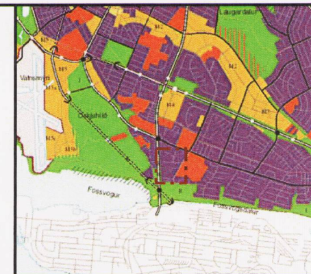
Hluti af Aðalskipulagi Reykjavíkur 2001 - 2024

Engin breyting er gerð á upprætti deiliskipulags. Í greinargerð deiliskipulags, í skilmálum er varða byggingarreiði kemur fram að einstaka minniháttar byggingarhlutar s.s. lyftustokkar megi ná út fyrir byggingarreit. Lyftustokkur við bygginguna er því í samræmi við heimildir deiliskipulags.